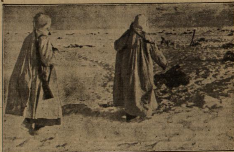
Am Morgen nach einem Nachtangriff der Bolschewisten. — Männer der Waffen-SS gehen zwischen den Leichen der Bolschewisten vor.