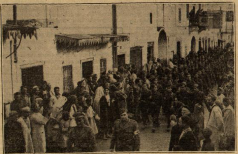
Italienische Truppen in der Stadt Tunis. Die Bevölkerung nimmt lebhaften Anteil.

Nürnberg, 19. Januar Das durch Knappheit gewisser Dinge während der letzten Zeit übliche Tauschangebot in den Anzeigenseiten der Tageszeitungen treibt oft seltsame Blüten. Es werden dabei die unglaublichsten Gegenstände zum Tausch angeboten. Den Vogel scheint aber ein Tauschhustiger in Nürnberg abgeschossen zu haben. Er veröffentlichte dieser Tage in einer Nürnberger Tageszeitung eine Anzeige, in der er »guten Kuhmist gegen einen guten Gehrock zu tauschen« sucht. Es ist doch noch nicht alles dagewesen . . .