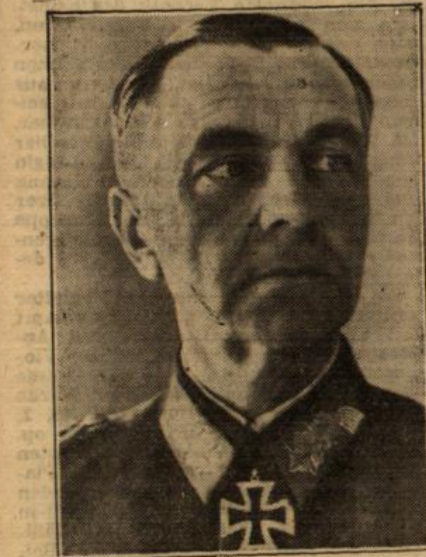
Generaloberst Paulus, dem der Führer das Eichenlaub zum Ritterkreuz verlieh.