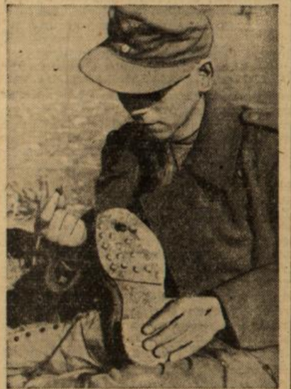
Bei einem feindlichen Luftangriff hatte dieser Soldat in Tunisien großes Glück: ein Splitter der feindlichen Bombe blieb in der Schuhsohle stecken, ohne ihn zu verletzen.

Wochen vergehen. Hier oben in der verfluchten Wetterecke der Welt, vor der Neufundland-Bank, folgen sich die Winterstürme in buntem Wechsel und verlangen den Männern von „U.“ alles ab. Tag für Tag zieht „U.“ seinen Suchkreis, aber es ist wie verhext.