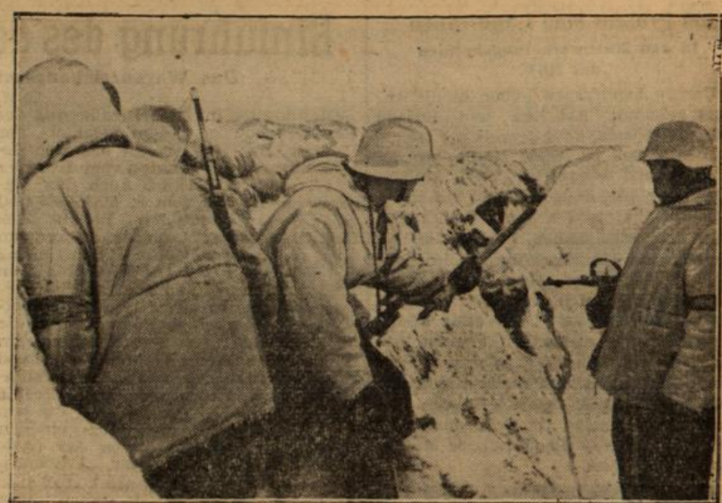
Mehrere Male am Tage macht der Kompaniechef seine Rundgänge durch die Stellungen, um sich von seinen Zugführern und Grenadiern berichten zu lassen, was es im Grabenabschnitt für Neuigkeiten gibt.

Schon wird es Spätnachmittag. Da meldet der Ausguckposten ein „U-Boot steuerbord querab.“ Alle Gläser richten sich auf das langsam sich nähernde Boot. Welch unförmiger Leib wälzt sich da heran. Viel viel größer als das Kampfboot, breiter, dickbäuchiger, nähert es sich langsam „U.“. Dann laufen beide Boote in Wurfleinenentfernung nebeneinander her. Die Kommandanten verständigen sich mit der „Flüstertüte“. Eine Wurfleine fliegt von Boot zu Boot, von kundigen Händen ergriffen. Mit ihr wird ein dickes Seil herübergezogen. Dann folgt der Oelschlauch, der sofort an den Übernahmestutzen des Bootes angeschlossen wird. In unablässigem Strom läuft das kostbare Naß in die leergefahrenen Bunker von „U.“ ein. Nach Stunden lösen sich beide Boote