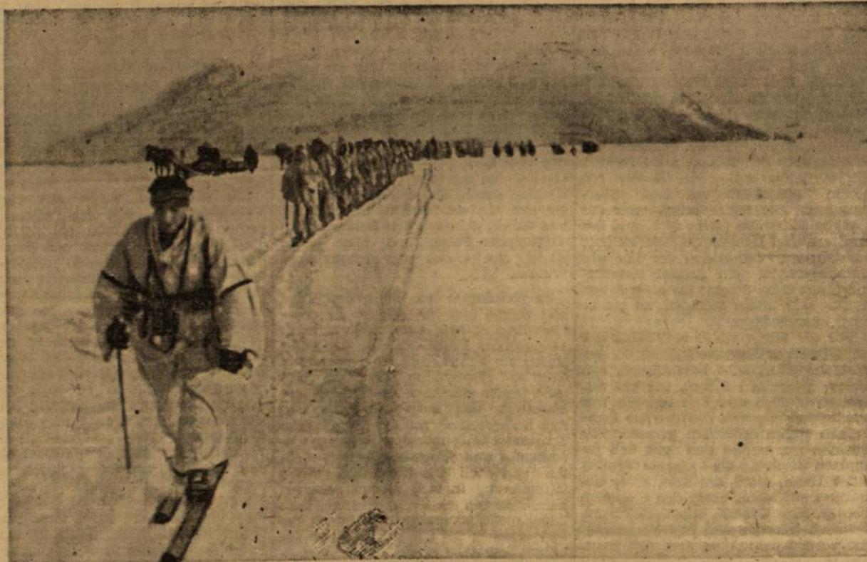
Heimkehr von einem Stoßtruppannehmen. Wie ein Gebirge liegt hinter den Jägern der Rauch, der sich über einer eben vernichteten sowjetischen Stellung erhebt.

Soviet unfreiwilligen Humor wie bei Exhaakon und Excripps hätte man gar nicht erwarten sollen. Die einzigen, die das richtige Verständnis für die großartige Zukunft der Welt haben, dürften die Bewohner der Antillen und der anderen, von den Alliierten besetzten Gebiete sein.