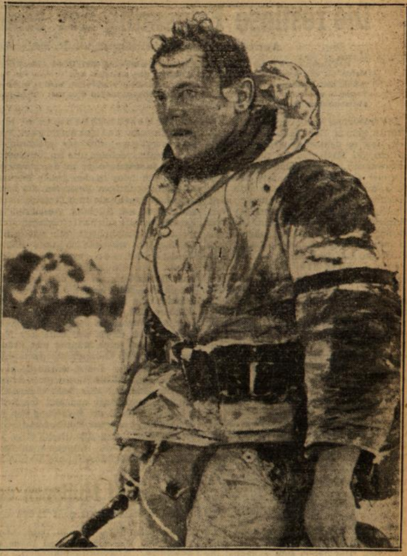
Abgeriegelt und aufgerieben! Die Schlacht ist geschlagen. Das Gesicht des Grenadiers trägt noch die Spuren harter Kämpfe.

dem, was ihr entging. Man mag glauben, daß die guten camaradas espagnoles in solchen Fällen zumindest nicht schlechter fluchen können als wir! Für das Temperament ihrer südlichen Art mußte nun etwas geschehen, das dem Gleichgewicht, der eigenen Stimmung wieder auf die Beine half. Fast war die hinuauernde Schlappse vergessen, die den Bolschewisten zugefügt worden war. Es wurmte in jedem... um eine halbe Stunde! Irgendwie mußte etwas erfolgen, was es auch war.