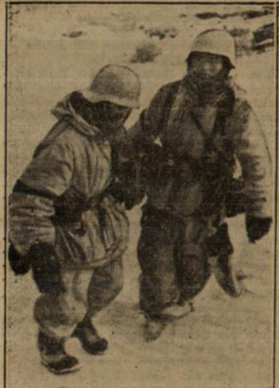
Zwei Grenadiere ziehen südostwärts des Irmensees einen Mulden-schlitten hinter sich her, auf dem ihr Gepäck liegt.