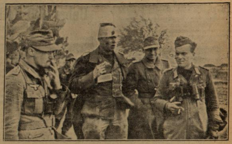
Der Abteilungskommandeur der Panzer, der bei einem erfolgreichen Panzervorstoß gegen einen feindlichen Stützpunkt in Tunesien verwundet wurde, bespricht mit seinen Offizieren die Lage nach der Einnahme des Stützpunktes.

Ueberlegenheit deutschen Materials 125 schwere und schwerste USA-Panzer sind in wenigen Gefechten der Ueberlegenheit unserer Panzer, unter denen sich gleichfalls schwerste Typen befanden, zum Opfer gefallen. An Geschützen und Selbstfahrlafetten sind es über 50, während die, abgeschossenen und erbeuteten Panzerwagen der amerikanischen Infanterie die Zahl 40 überschritten haben. Mehr als 1200 Gefangene sind eingebracht, aber noch liegen nicht von allen Kampfabschnitten die Meldungen vor, die Zahlen werden sich noch steigern. Mit einem unbezähmbaren Schwung, in letzter soldatischer Einsatzbereitschaft und mit absolutem Willen zum Siege gegen einen an Ma-