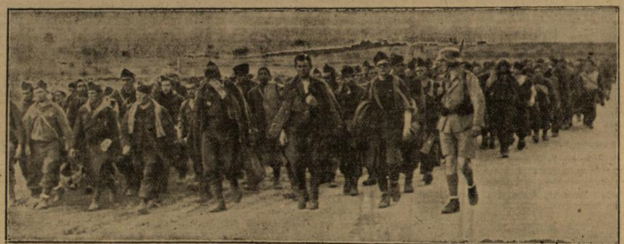
Marsch ins Sommerlager. Fremde Staatsangehörige aus allen möglichen Ecken Europas, die für die Interessen der Plutokraten in Afrika kämpfen sollten und nun an der tunesischen Front gefangenommen wurden.

Wenn ihr die Erreichung dieser Zieles versagt blieb, so ist das einzig und allein das Verdienst Adolf Hitlers, der sich in letzter Stunde entschloß, der ganz Europa drohenden Gefahr entgegenzutreten.