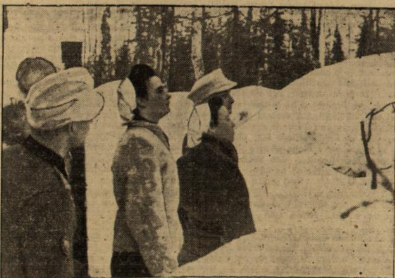
Schwesterbesuch im vordersten Graben eines Frontabschnittes im karälischen Urwald. Ein Kompaniechef zeigt den Schwestern, die sonst wenige Kilometer hinter der Front die Soldaten betreuen, die feindlichen Stellungen.

Daß auch die einheimischen Menschen im Reichskommissariat Ukraine vom Wert der deutschen Führung überzeugt sind, zeigt ihre Haltung in diesen Monaten der Winterschlacht. Es war eben nicht so, wie von anglo-sowjetischer Seite oft behauptet wird, daß Aufruhr und Plünderung, Chaos und Terror herrschten. Die ukrainischen Bauern und Arbeiter gingen in aller Ruhe weiter ihrer Arbeit nach. Sie wußten, was sie an der gerechten und großzügigen deutschen Führung gewonnen hatten. Die Versuche Moskaus, durch mit Fallschirm abgesetzte Agenten zersetzende Parolen zu verbreiten, um Unruhe zu schaffen, fielen nirgends auf fruchtbaren Boden. Auch die chauvinistischen ukrainischen Emigranten bewiesen durch ihre Verstiegenheit erneut, daß sie über-