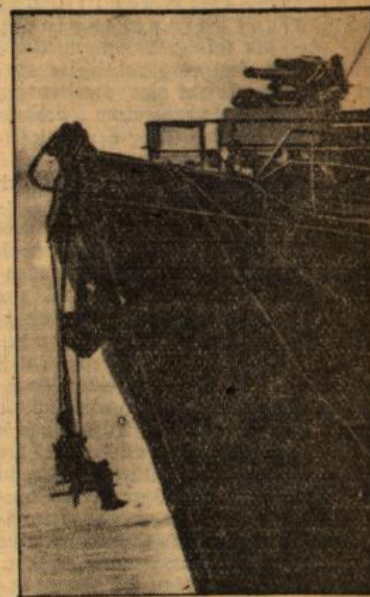
Vorpostenboot im Hafengebiet. Zwickel Bug und Wasserspiegel schwebt der Matrose auf einem von starken Tauen gehaltenen Brett und gibt der Schiffswand einen neuen Anstrich.

den Inseln Pantelleria und Lampedusa größere Truppenverbände zu landen, stark gestört. Truppentransporter, Kreuzer und Landungsboote sind dabei den schneidig geführten Angriffen unserer Kampfflugzeuge zum Opfer gefallen.