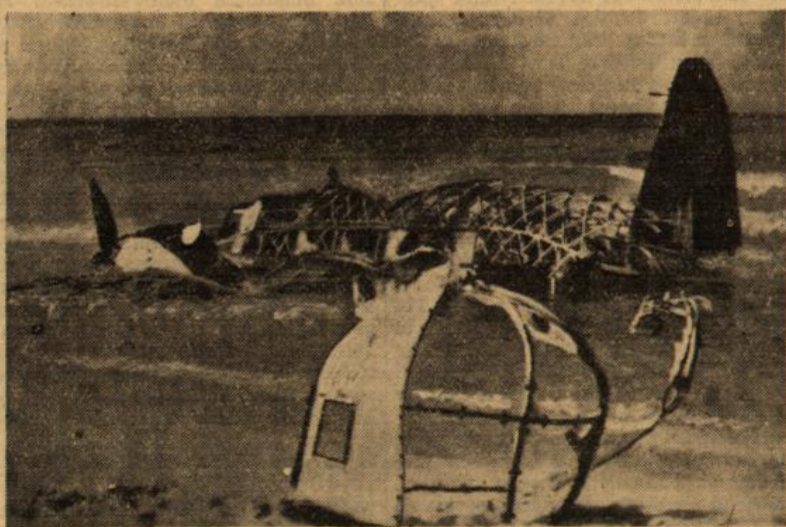
Ins Meer gestürzt! Die Ueberreste eines von der italienischen Bodeneinheit bei einem Einflugversuch in das italienische Küstengebiet zum Absturz gebrachten Feindbombers.

Berlin, 15. Juni Die ausgeprägte Kampfpause an der Ostfront dauert, abgesehen von örtlichen Angriffen, weiter an. Dies in einer Jahreszeit, die an sich für große Operationen durchaus geeignet wäre.