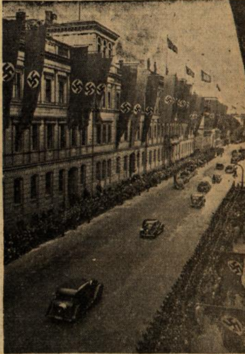
Links: Ungeheurer Jubel braust dem Führer nach der Vertragsunterzeichnung entgegen. — Mitte: Ribbentrop begrüsst Graf Ciano in Tempelhof. — Rechts: Cianos Auffahrt zur Reichskanzlei.