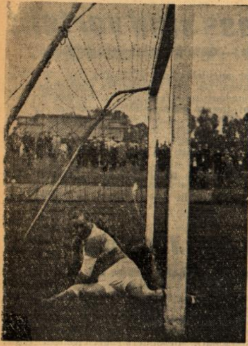
Das erste Tor des Rasensportklub im Spiel gegen Schletstadt, das angezweifelt wurde. Caspar hatte sich aber vergebens geworfen, wie unser Bildokument bezeugt.

Caspar gutes Können. Auch der linke Angriffsflügel brachte durch sein schnelles Zu- und Abspiel einen forschen Zug in die Fünferreihe.