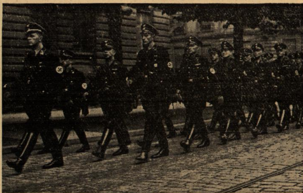
Der Karlsruher Ehrensturm auf seinem Marsch durch die Stadt.

Eindrucksvolle Kundgebung der SS im Sänglerhaus — Aufgaben und Ziele der Schutzstaffeln