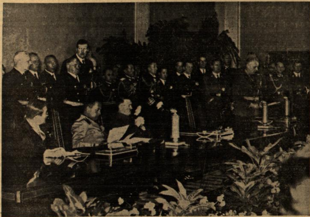
Reichsminister des Auswärtigen von Ribbentrop verliert in der Reichskanzlei seine Ansprache. Von links nach rechts der japanische Botschafter Exzellenz Kurusu, der italienische Aussenminister Graf Ciano, der Führer und Reichsminister von Ribbentrop.