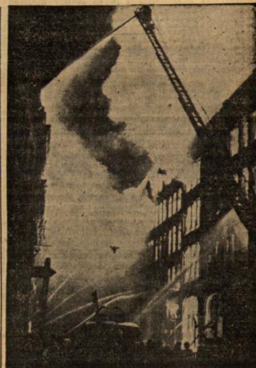
Deutschlands Vergeltungsschläge: Riesenbrände lodern in der Londoner City.

Die Tatsache, dass selbst Regierungsmglieder in Vichy von einer Schieberbande beliefert wurden, lässt erkennen, dass die kritischen Stimmen, die dem »neuen Kurs« Korruption vorhielten, Recht behalten haben. Nach unserer Ansicht ist aber ein derartiges Regime nicht befähigt, Frankreich aus seinem innerpolitischen Chaos zu führen.