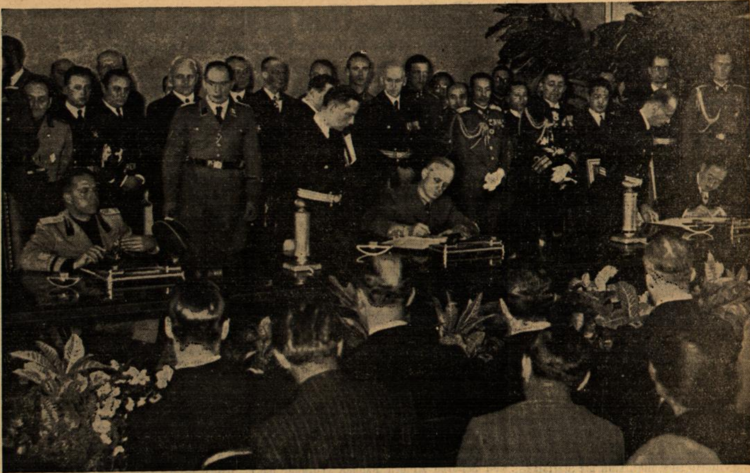
Die Unterzeichnung des Dreierpaktes: Graf Ciano, Ribbentrop und der japanische Botschafter Kurusu setzen die Unterschrift unter dem Vertragsentwurf.

Dazu ist übrigens unser elsässisches Volk viel zu gesund! Wir sind ein Volk der Zuversicht und der Arbeit, ein Volk der Ordnung. Deshalb erschöpfen wir uns nicht in der Betrachtung von kleinen Nöten der Gegenwart, sondern blicken vertrauensvoll in die Zukunft. Wir wollen das grösste