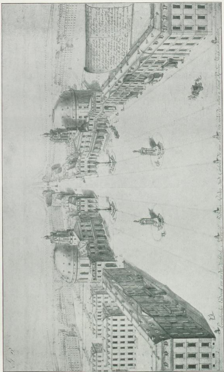
Marktplatzentwurf von Pedetti