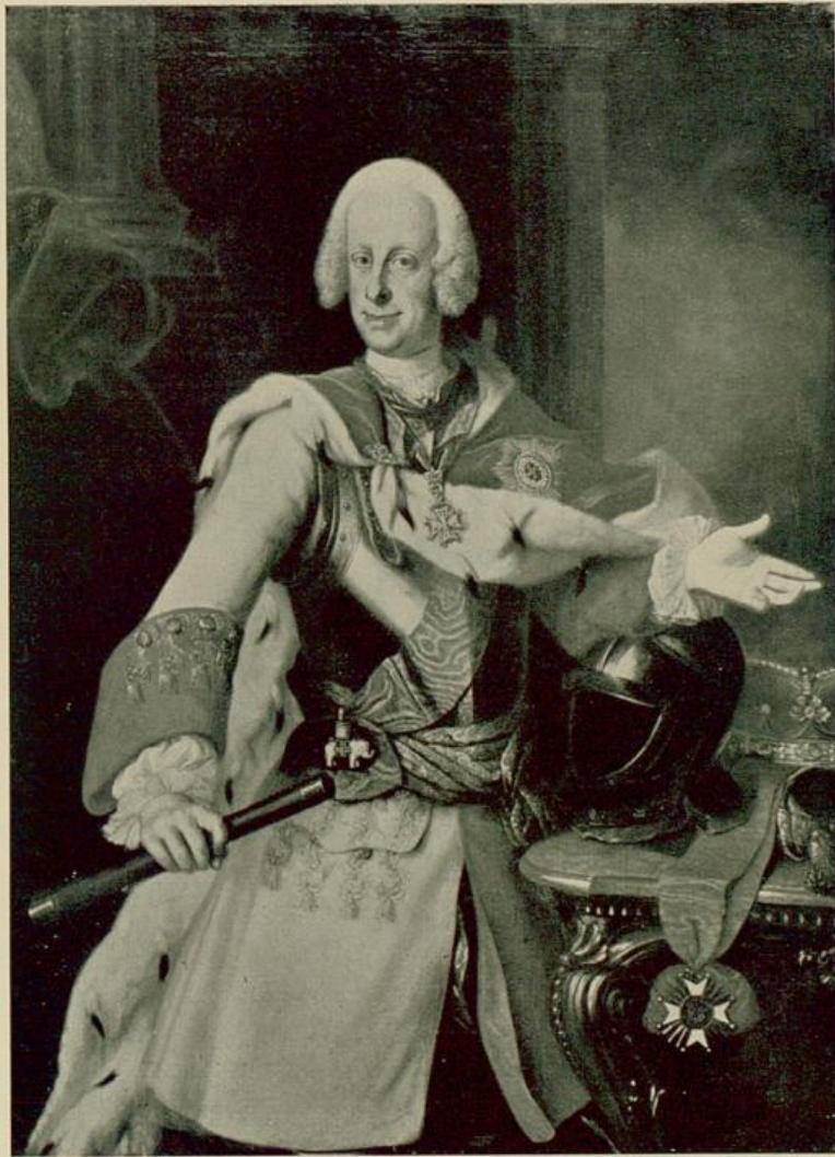
Landgraf Ludwig VIII. von Hessen-Darmstadt, der Vater Karoline Luisens.