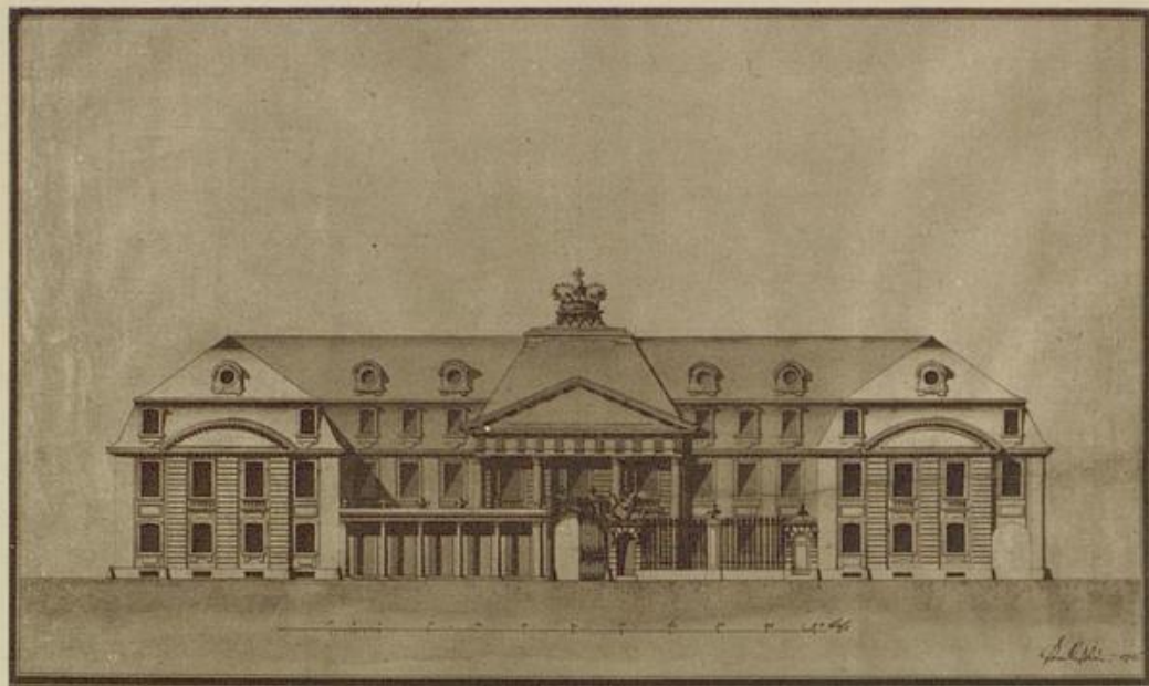
Abb. 65. Projekt v. Kestlau's für ein neues Kanzleigebäude. Fassade an der Kammstraße, sign. „von Kestlau“.