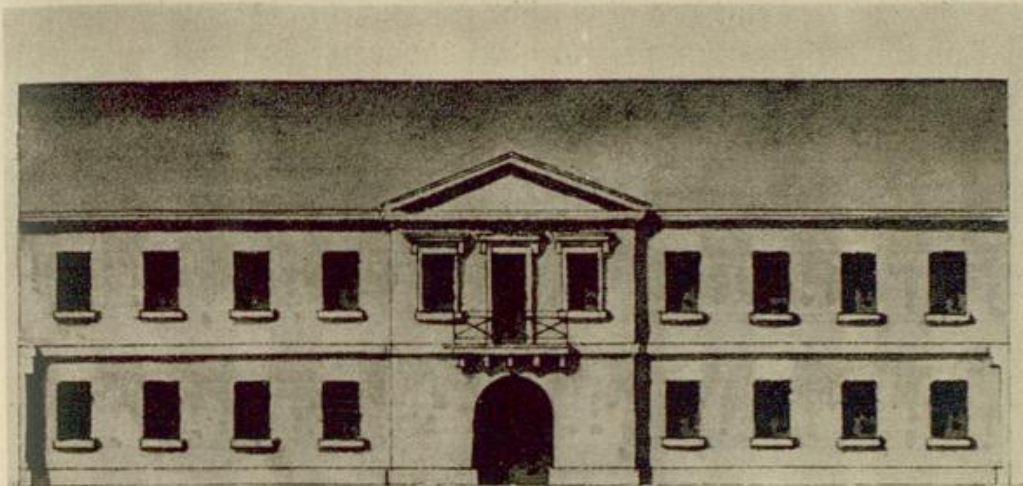
Abb. 64: Fassadenentwurf des Baumeisters Fischer für eine neue Kanzlei auf den Grundstücken Nr. 7 und 9 der Erbprinzenstraße

„der Wohnung eines Einsiedlers gleich gemacht“, gelegentlich auch mit Springbrunnen versehen, „daß man in warmen Sommertagen sich darin abkühlen könne“, 97 also ein Lusthaus, eine „im vorigen