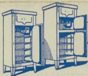
FÜR DEN HAUSHALT