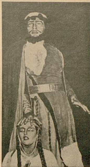
Zum Gastspiel des Moskauer Hebräischen Theaters „Habima“ am 20. und 21. November 1929