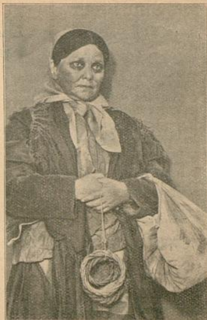
Zum Gastspiel des Moskauer Hebräischen Theaters „Habima“ am 20. und 21. November 1929