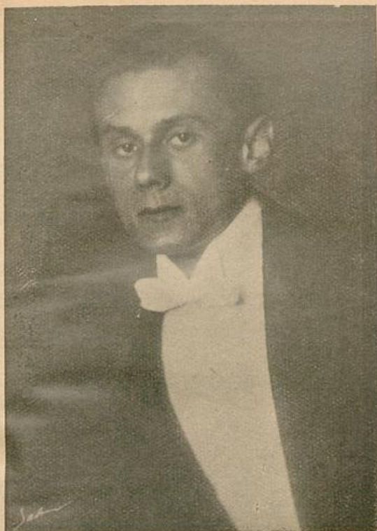
JOSEPH WITT gastiert am 24. November als „Florestan“ in Beethovens „Fidelio“