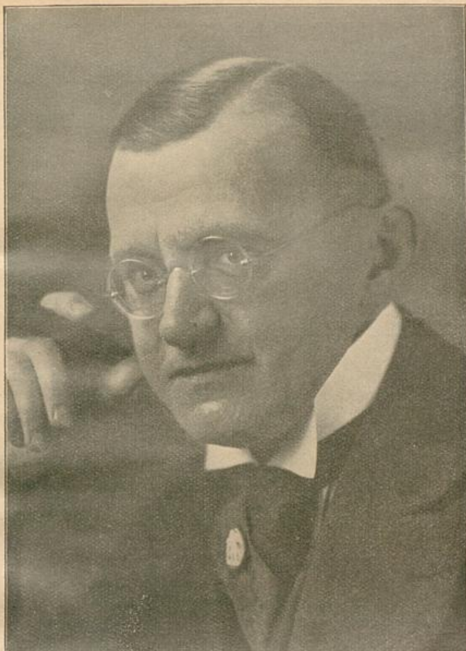
ULRICH VON DER TRENCK