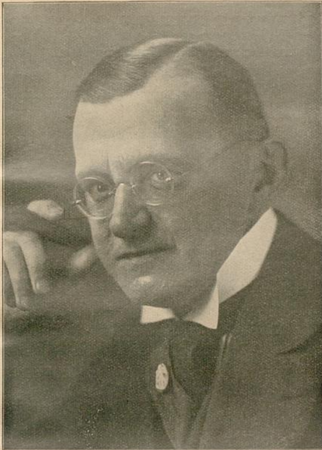
ULRICH VON DER TRENCK