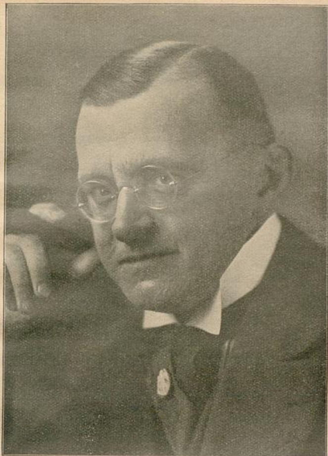
ULRICH VON DER TRENCK