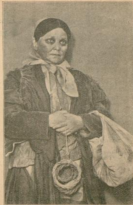
Zum Gastspiel des Moskauer Hebräischen Theaters „Habima“ am 20. und 21. November 1929