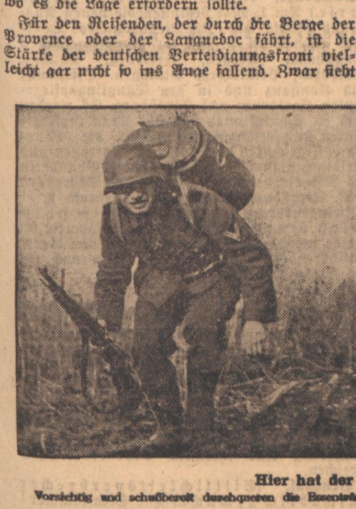
Hier hat der Feind Einsicht. Vorsichtig und schachtern durchgehenden die Essensvorräte des Geländes und arbeiten sich weiter nach vorn.

Sor den Toren Athens liegt die Flüchtlingsstadt Neu-Smyrna. Man muß von der Endstation der Straßenbahn noch 10 Kilometer laufen, denn das Taxi, das man früher genommen hätte, ist nicht zu bezahlen, es sei denn, daß man das wertvolle „plomi“ (Brot) oder den begehrten Zucker als Zahlungsmittel anbieten kann.