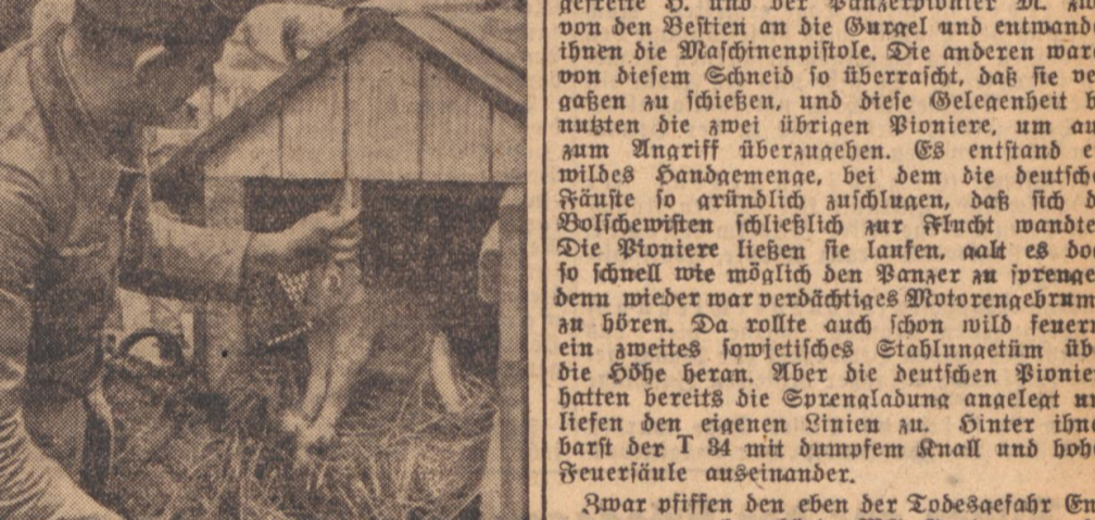
Einer kam auf die Idee sich einen kleinen Verschluss für sein Kaminchen zu bauen. Heute ist fast jeder Batteriegehörige ein erfahrener Kaminchenmacher geworden.

Ein Beispiel solch unerhörter Kaltblütigkeit, bei der sie sich zuerst in ausichtsloser Lage befanden und dann doch als Steiner hervorwanden, haben lebt wieder vier deutsche Pioniere bei den harten Kämpfen südwärts im Tal der Vollebrunn. Er weiß, daß er den anderen an Mut und Können überlegen ist, und sogar in Situationen, wo alles für ihn verloren scheint, da wirkt er dennoch seinen ganzen Mut in die Waage des Glücks und gewinnt es auf seine Seite.