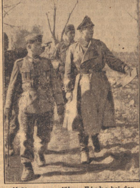
4-Obergruppenführer Eide bei der Besichtigung eines Kampfabchnittes