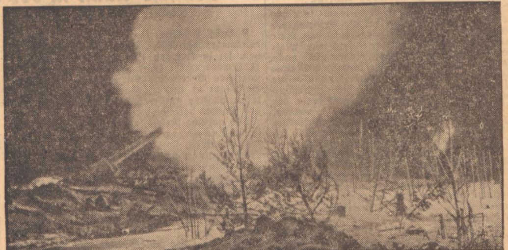
Nachts am Ladogasee: Mitten in der Nacht hat die Batterie plötzlich Feuerbefehl erhalten. Schuß auf Schuß jagt aus den Rohren, für Sekunden erhellt das Mündungsfeuer die Geschützstellung und wieder wird ein nächtlicher Angriff der Sowjets abgeschlagen.