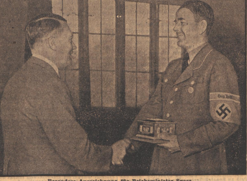
Besondere Auszeichnung für Reichsminister Speer. In Anerkennung seiner einmaligen Leistungen auf dem Gebiet der deutschen Technik überreichte der Führer...