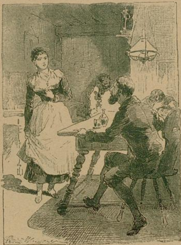
„Rauchensteiner!“ hob sie an, „ich kann den Flori nicht vergessen.“

Orgeltöne brausten durch den geweihten Raum, die Ge-