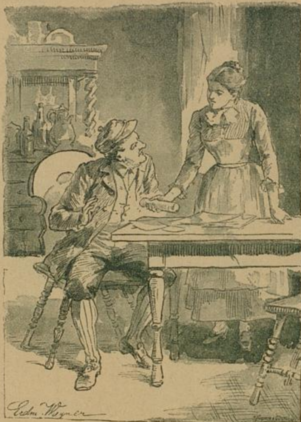
„Einen schönen Gruß vom Vater und hier schickt er Euch das Geld.“

„De da, der alte Huber,“ rief dieser ihm freundlich entgegen und schüttelte ihm die Hände, „was bringt Ihr mir Gutes? Wie geht's? Wie steht's?“ „Ach Gott, schlecht,“ erwiderte Huber kleinlaut, „das Haus gehört dem Staat, das Vieh dem Levi, das Land dem Moses. Morgen kommt das Gericht und nimmt mir das letzte, wenn ich nicht einhundert Thaler anschaffe. Und darum komm' ich ja zu Euch.“ „Ich verstehe, ich verstehe,“ unterbrach ihn der Geschäftsfreund lebhaft, „ja so sind die Zeiten heute. Diese böse Konkurrenz! davon laßt mich reden. Wollte ja gerade in diesen Tagen zu Euch kommen, um Euch um ein Thaler fünfzig Vorichuß zu bitten, aber nun muß ich mir wohl anders helfen. Da drüben der reiche Müller, zu dem müßt Ihr gehen, der hat Geld wie Heu, was sind dem 100 Thaler!“