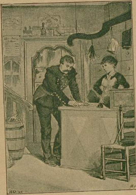
Er nahm die Feder vom Schreibpulte und schrieb auf die Rückseite des ersten.

„Was ist los?" wiederholte er, ganz außer sich. „Wir selber sind los von Haus und Hof, wenn ich nicht