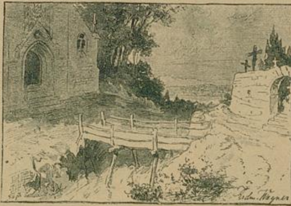
Die Brücke sieht noch heute — zwischen Traualtare und Grab.

„Nicht so. Ein Kreuzfisel laß' ich aufstellen mitten auf der Brücke, zum Angedenken an die Gefahr.“