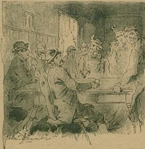
Da kam Lisi, die Ausstillstellnerin, in die Stube.