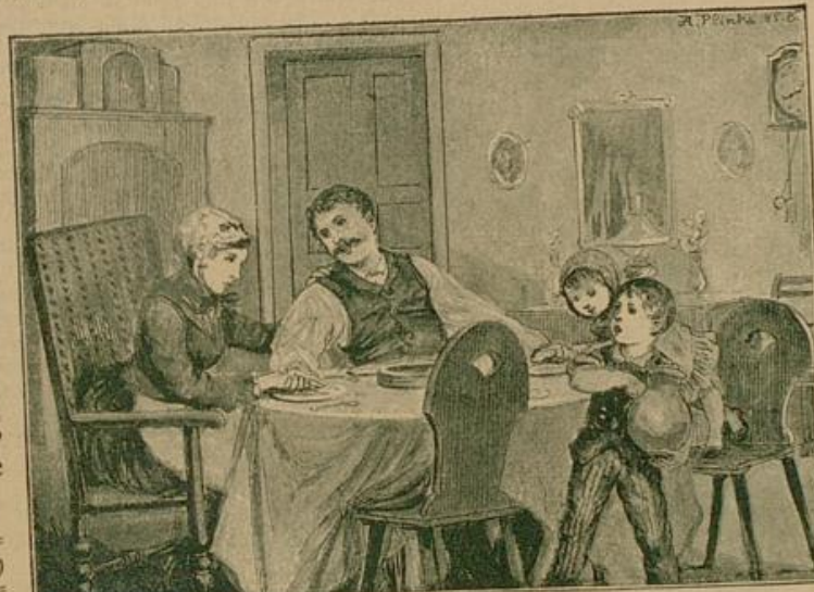
"Als ob ich keinen Krug tragen könnte!" brummte Frischchen beleidigt.

als Verstand!" das socht den glücklichen Eduard nicht an; er hatte wenigstens Verstand genug, über Kleinigkeiten hinwegzusehen. Sein Vater, ein zurückgekommenes Bäuerlein, starb alt und lebensfatt, und hinterließ ihm, dem einzigen noch übrigen Sohne, nicht nur das verschütteres Häuschen mit ein paar Stüden Land, sondern auch einen verwickelten Rechtshandel mit einem harten Gläubiger, den er nach seiner Meinung