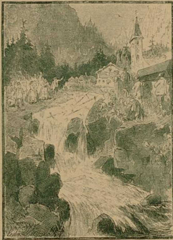
Und der Leichenzug hier und der Hochzeitzug dort standen da und wußten nicht, was jetzt anfangen.

Dieses erinnerte sich in solcher Not an einen reichen Bauern, der auf dem Berge sein Haus hatte und der hartberzige Gerhab hieß. Seit Jahrhunderten trug der Bauernhof diesen unchristlichen Namen; mancher der Besitzer war hartberzig, mancher weichberzig gewesen, um den Namen hatte sich keiner viel gekümmert und niemandem fiel es auf, wenn der Pfarrer manchmal von der Kanzel verkündete: „Am nächsten Freitag läßt der hartberzige Gerhab eine heilige Messe lesen für die armen Seelen im Fegfeuer.“ Der gegenwärtige Besitzer — ein Mann, der das Herz auf dem rechten Fleck hatte, nämlich in der Nähe der Brieftasche — ärgerte sich des Namens und er beschloß; ihn gründlich zu Schanden zu