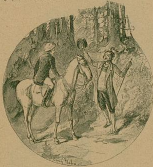
„Eure Nummer ist herausgekommen!“

„Hurra! Warum habt Ihr das nicht gleich gesagt?“ rief der überglückliche Schmitz. Jetzt hatte er Zeit und