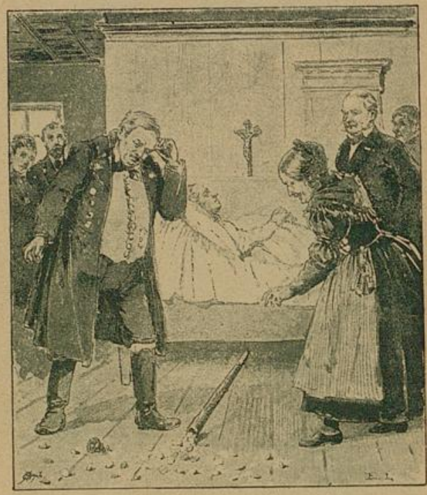
... Da plötzlich ein Ausschrei der Bernhardshoferin.

„Da schau," rief sie mir zu, „ist das eine Leinenkammer, wie's sich für einen Hof, wie der untrige ist, gehört? Alles fehlt, wie Tisch- so Betttücher und groß und klein. Schänen muß ich mich, wenn Krende herkommen. Und da verlangst du von mir 160 Gulden?! Der Teufel soll mich holen, wenn ich auch nur einen Kreuzer in der Tasche hab!" — Ich wollte fort. — „Unbewirtet darfst nicht weg!" rief sie. Rasch eilte sie in die Küche und schnell genug brachte sie mir ein