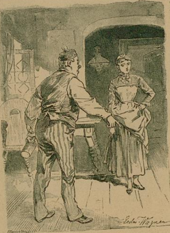
„Von heute ab gehst du mir nicht mehr in den Löwen!“

Von jetzt ab glichen die beiden Gasthöfe zwei feindlichen Heerlagern, in denen es summt und arbeitet, weil von einem zum andern Mienen und Gegenmienen gegraben werden. Der Klemens hatte längst vorgehabt, seinen verräucherten „Adler“ auf dem verweirerten Wirtshauschild frisch malen zu lassen, jetzt machte er sich eifrig daran, und die Schnackstedter waren eines Tages