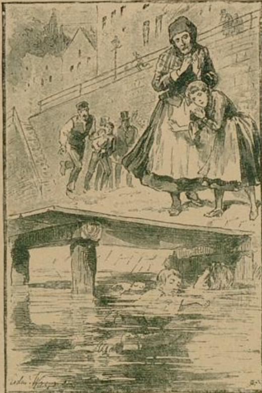
Der arme Knabe hielt mit seinen Armen den braven Soldaten fest umschlungen.

Seine heldenmütige Aufopferung erweckte allgemeine Teilnahme, und das Leichenbegängnis am 10. Juli ge- staltete sich zu einer erhebenden Kundgebung. Die Totenkammer des Garnisonlazarets war in einen Hain von Fächerpalmen und Fierpflanzen umgewandelt wor- den. Dort stand, von Blumen umgeben, der offene Sarg. Der Tote lag in seiner Uniform, die Feldmütze auf dem Kopfe, wie ruhig schlafend da. Unter den vielen Kränzen und andern Liebeszeichen machte einen besonders rührenden Eindruck der vom dankbaren Vater des ertrunkenen Knaben gewidmete schlichte Perlenkranz mit der Inschrift: „Dem mutigen Retter meines Kindes.“ Bald nach 3 Uhr erschien die erste Kompagnie des sächsischen Infanterieregiments und ging, Abschied von dem braven Kamera- den nehmend, langsamen Schrittes an dem Parabe- bett vorbei. Um dieselbe Stunde erklangen zum erstenmale die Glocken der Neufirche und entboten mit ihrer mächtigen ehernen Stimme den Gruß der dankbaren Stadt an den Toten, an das Regiment und die gesamte Garnison, an das deutsche Heer, das solche „Helden im Frieden“ zu den Seinigen zählt. Bald nachher warfen, aus der Ferne zu der Trauer- feier herbeigeeilt, die bei- den Schwestern, der Bru- der und der Schwager des Verbliebenen den letzten wehmütigen Blick auf das teure Angesicht. Dann schloß sich der Sarg über ihm.