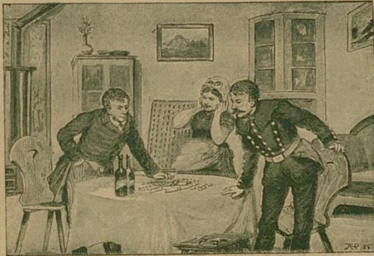
Er fuhr in die Tasche und zählte häßig Banknoten und Goldstücke auf den Tisch. Auen ganzen Pauken

ich nun zum Glück nicht. „Und Sie haben meine Muster noch gar nicht angesehen. Was können Sie gebrauchen — Kaffee? Reis?“ Mit Mühe ward ich ihn los und las nun deinen Brief in Ruhe nochmals durch. Den Schluß verstand ich nicht, hielt ihn für Spaß, wo solltest du wohlhabiger Mann Geld nötig haben? Aber ich jubelte über