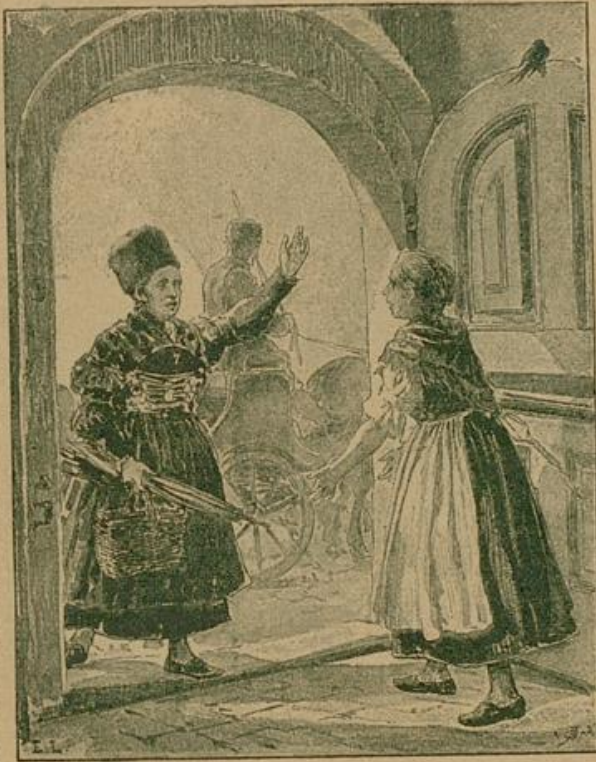
„Jesus! dieser Jammer! Der Flori tot und ich nicht dag'wesen!“

gar nicht trennen. Aber leider waren die übrigen in der Stube gleichfalls Verwandte Grinzenbergers und jeder wollte den „langjährigen, treuen Begleiter des edlen Verbliebenen“ genau beschauen. Ja, der Hofrat wog sogar den Stod einmal um das andere in der Hand, um schließlich zur Überzeugung zu gelangen, „daß das Ding für einen Hästinger von auffallender, höchst bedenklicher Schwere sei.“ Und dasselbe fanden nun plötzlich auch all die andern. Der Stod ging abermals von Hand zu Hand, verwundert fragte man sich, was ihn so schwer machen könne. . . . Da plötzlich ein Aufschrei der Bernhardhoferin, ein Gekirr wie von zu Boden fallenden Goldstücken, und aller Blicke lagen starr auf blinkenden Dutaten, die teils zu einem Häuflein auf dem Boden lagen, teils in der Stube umherrollten.