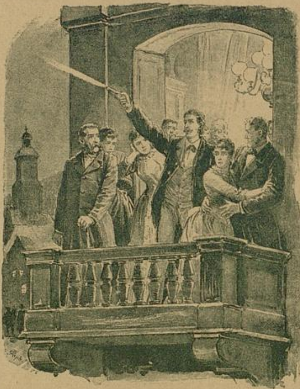
„Prost Neujahr! Prost Neujahr!“

Und die Leiche Grinzenbergers war auch noch warm, als der Bruder, der Kornhändler, auf feurigen Klappen im tausenden Galopp dahergesprenzt kam. Und nach zwei, drei Stunden fanden sich die Bettern und die Basen ein, und am Abend desselben Tages noch erschien hier auch der Herr Hofrat aus der Residenz, und mit