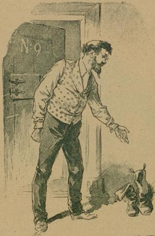
„Das ist doch ein liebedlicher Hausknecht hier!“

Die vielfachen übernatürlichen Dienste, welche das Salz dem Menschen dem Volksglauben nach leisten kann, bedingt auch bei ihm wie beim Brote eine gewisse Heilighaltung, wenn auch nicht in dem Maße wie bei diesem. Bereits Homer nennt es das göttliche und Platon im Timäus einen gottgeliebten Körper; der Griechen verglich es auch wohl mit den Chariten und nannte es nach ihrem Namen, weil sein Zusatz die meisten Speisen dem Geschmacks angenehm und reizend mache, oder er betrachtete es, wie Plutarch thut, als die Seele, welche sich mit dem toten, einen Teil einer Leiche bildenden Fleische verbindet und ihm dadurch Reiz und Wohlgeschmack giebt. Nach dem Tiroler Glauben ist es überhaupt Eigentum der Engel, gerade wie der Schwefel dem Teufel zugehört. Unsere Vorfahren glaubten sogar die Gegenden, welche von einem salzführenden Fluß durchströmt wurden, dem Himmel näher und dort gesprochene Gebete daher am wirksamsten und stritten öfter mit Erbitterung um heilige Salzquellen; nach der Edda- sage wurden auch die Götter aus salzigen Eisblöcken durch die Kuh Audhumbla hervorgeleckt. Bei den Orientalen tritt dieses hohe Ansehen des Salzes gleichfalls mehrfach auf. Das Spielen mit Salz sowie das Fortschütten an-