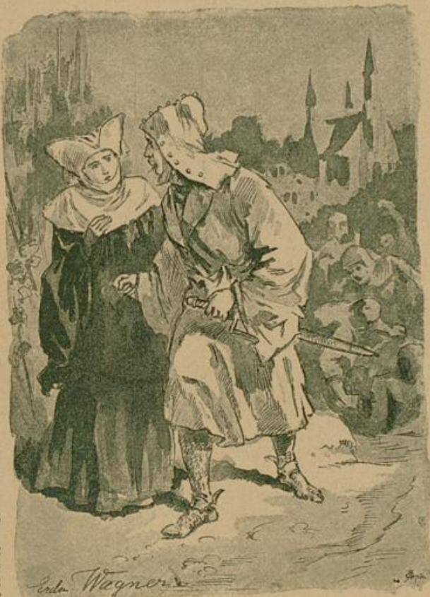
„Habt keine Furcht, es sind Freunde, die Euch wehthun.“

Dunpff tönte die große Heerpaule auf der Brücke, und die Trommelschläge der Knechte schlugen das „Kommt,