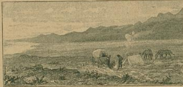
Eine halbe Stunde stromabwärts machte sich ein zweites Lager bemerklich.

als unsere beiden besten Gänle drauf gingen. Schoß er selber die Pfeile nicht ab, die ihnen des Morgens zwischen den Rippen steckten, so geschah's auf seine Veranlassung. Indianer genug hier herum, die für weniger als eine wollene Decke ein halbes Dutzend Tiere abschlachten. Aber die Todesursache der früher gefallenen Gänle könnt' er sicher ebenfalls aus-