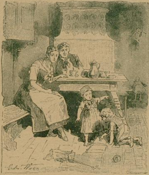
Hell und warm blickt die liebe Sonne durch die blank geputzten Fensterscheiben in die Wohnstube des jungen Paares.

Über drei Jahre sind vergangen, seit sie den alten Freibauern, der in jener Nacht doch schwere innerliche