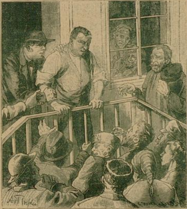
Ihr liebe Leut', wenn Ihr glauvt, Ihr könntet mich zum Wählen bringen, so seid Ihr auf dem Felzweg."

Der Herr Pfarrer in Schlaubach hatte das Pfarrgut in eigener Bewirtschaftung und betrieb diese mit so großem Eifer, daß er in Hof und Feld selbst mit Hand anlegte, manchmal sogar beim Aufladen des Mistes half, weshalb ihn seine Kollegen in der Umgegend nur den „Mistler" nannten und die Bauern im Dorf meinten, seine Schafe und Kälber machten ihm mehr Sorge als die geistliche Herde, die er zu hüten hatte. Ein kleines Abenteuer, das dem würdigen Herrn eines Tages passierte, wollen wir hier einschalten, wenn es auch gerade nicht zu unserer Geschichte gehört. Derselbe war sehr hauswälterisch und genau und als eines Morgens die Viehmagd im Bett liegen