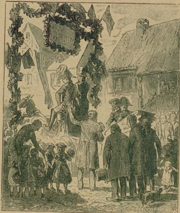
„Ja,“ sagte der Bürgermeister, „wir haben aber auch Eure Heil einen schönen Galgen gepugt.“

Mit den Fremdwörtern lebte der Bürgermeister auf vollständigen Kriegsfuß. Er suchte zwar etwas darin, seine eigenhändigen Schriftstücke mit denselben auszumücken, dabei passierten ihm aber mitunter possierliche Dinge. Daß er im Wochenblatt bekannt machen ließ, er werde die Gemeindefrieden in chronologischer Reihenfolge verpachten, will noch nicht viel sagen; daß er aber auf ein Rundschreiben der Regierung, wie es in den einzelnen Orten mit dem Luxus und der Industrie stände, berichtete: die Kurze seien schon lang in der Gegend ausgerottet und von dem Vaster der In-