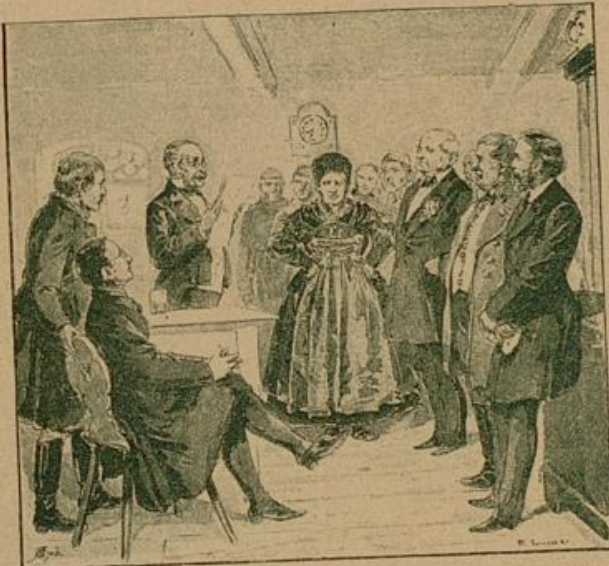
Kurz, alles, was mein ist bis zur Stunde meines Todes, gehört von dieser Stunde an meinem braven Vetter, dem Schriftsteller Vorn.

Allmächtiger! An wen mich nun wenden? Ich war schon im Begriffe, mir das Leben zu nehmen, als mir der „Lump“ einfiel. Sonst hieß er eigentlich Robert Vorn und war auch mein Vetter. Aber der Bruder, der Kornhändler, und die Schwester, die Bernhardhoferin, und all die Vettern und Basen nannten ihn nie anders als der „Lump“, weil er nichts arbeiten wollte. Er war zierlich gebaut, blondlockig, blauäugig, ein recht nettes, liebes Bürschchen, wenn er häß' was Necht-schaffenes machen wollen, etwa einen Stiefel, oder Dünghaufen umfüllen, oder dergleichen. Aber nein! Er