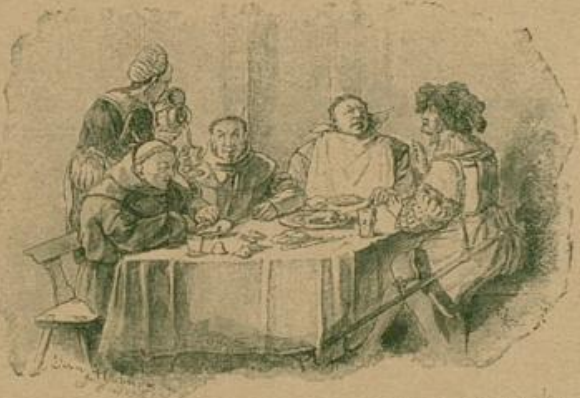
„Ja, ja, ich sehe, die Kur meiner seligen Ruhme hat herrlich angeschlagen.“

Eine Stunde später saß Hutten mit seinen Gästen an der festlich geschmückten Tafel. Die beiden Mönche mit noch gelben Lippen, von ihrem Eierfrühstück her, der Abt mit strahlenden Augen, denn die lustigen Gestalten seines Traumes, sie lagen vor ihm in genieß- und eßbarer Wirklichkeit, der Hirschbraten, die Kiefernforelle und der wilde Schweinskopf. Beim Anblick dieser Herrlichkeiten hatte der Abt aus seinem großen Borrat von Tischgebeten das kürzeste ausgewählt. Bei Tisch wurde wenig gesprochen und das Wenige wurde übertäubt von den klappernden Messern und Gabeln, mit denen die Mönche wütende Angriffe auf die duftenden Braten machten, und die Angriffe wurden nur unterbrochen, um die Becher zu leeren, die von dem dienstbereiten Hans stets wieder gefüllt wurden.