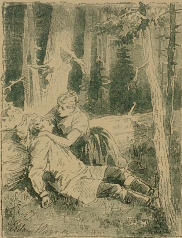
Sie trocknete ihm noch das nasse, weiße Haar und den fast erstarrten Nacken.

„Habt mir noch eine kleine Weile Geduld, Freibauer, dann soll Euch schnell Hilfe werden,“ sagte Gundel treuherzig. „Ich eil' doch für den Christoph nach Werna zum Doktor, der mag seinen geschickten alten Vater, der gerad' zum Besuch da ist, und die Peut' mit dem Korb schnell herschicken, damit sie Euch gleich sanft heimtragen können.“