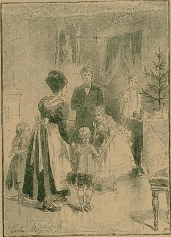
Gleichzeitig wurde ihnen auch ein hübsches Sämmchen blanker bayerischer Doppelgulden eingehändigt.

auch nicht mit lauter Stimme sangen: „Was gleicht wohl auf Erden dem Jägervergnügen?“ so dachten sie's doch und hofften, wieder einmal, wie schon so oft, ein saftiges Wildbret zu erlegen, das besser als Kartoffeln und Hafersgrütze und sogar als harter Schinken schmeckt. Die Jagdlust steck doch in allen, und bei ihrer Befriedigung kommt für einen rechten Bauern außer der Beute noch dreierlei heraus: das süße Bewußtsein, die Zahl der umgebetenen Gäste seiner Felder zu vermindern, dem gestrengen Herrn Förster ein Schnippchen zu schlagen und den verhassten reichen Jagdpächter zu ärgern. So schritten die guten Gesellen wacker vorwärts, ließen die pfliffigen Augelein rechts