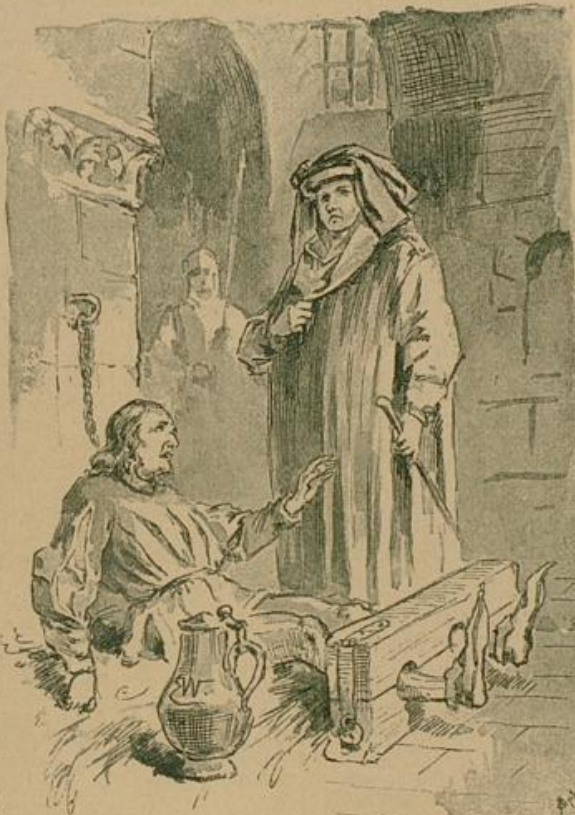
„Gerechtigkeit muß über Euch walten!“