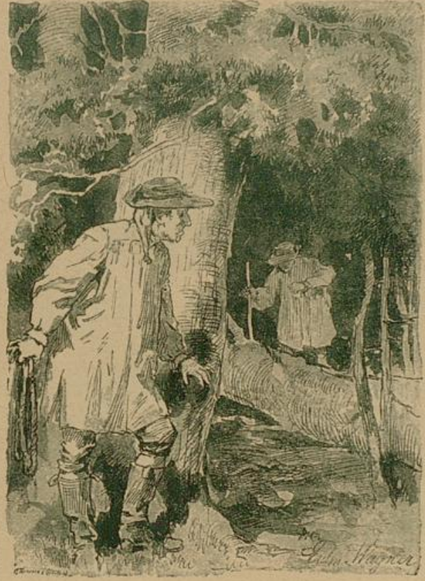
Er suchte mit krampfhaft gespannten Bügen auf immer näher kommende schwere Leitte.

kenbett des Bruders zu endlosen Ewigkeiten. Nach Mitternacht hatte der Christoph einen Blutsturz und dann, als es draußen gerade am ärgsten tobte und stürmte, solche Fieberphantasien gehabt, daß das Mädchen in seiner Todesangst die alte Frau oben aus dem Schlafe weckte. Als Christoph eine Stunde später nochmals viel Blut verlor, wollte Gundel im größten Unwetter sich auf den Weg machen und den Arzt aus Berna herbeirufen. Von der alten Frau ließ sie sich diesmal nicht zurückhalten, aber sie mußte beim ersten Schritt aus dem Häuschen selbst einsehen, daß unter solchen Umständen an ein Fortkommen nicht zu denken war. So saß sie denn am Lager des Bruders, seine feuchte Hand in der ihrigen haltend, und zählte die Minuten, bis der Sturm sich legen und der strömende Regen nachlassen würde. Zuweilen öffnete Christoph die großen glänzenden Augen und sah die Schwester mit einem so verklärten Blick an,