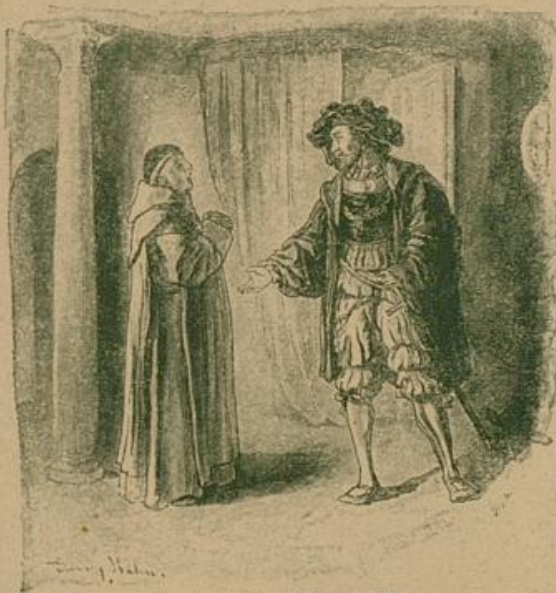
„Nehmet fürlieb, hochwürdiger Herr!“

"Natürlich, ein so frommer Herr," erwiderte Gutten und warf einen scharfen Blick nach der Tasche. "Nun, so lasse ich Euch denn jetzt mit Euern Erbauungsbüchern