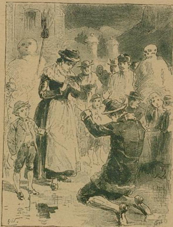
„Ich, Ysi, ich Glender hab' deinen Mann gemordet.“

„So sei's denn, barmherziger Gott!“ begann er, nachdem er tief Atem geschöpft und vor dem Weib des Verunglückten auf die Knie sank. „Ich finde keine Ruhe, armes Weib, in meinem Herzen, bis ich nit vor aller Welt mein Verbrechen bekenn! Ich, Ysi, ich Glender hab' deinen Mann gemordet, ja, ich war's, der vor fünf Jahren oben auf dem Kirchbergerleitenhang um Hil' verzweiflungsvoll rufen hab' hören und ein leichtes wäre es mir gewesen, deinem Flori noch zu helfen, der an einer Latzchen über'n Abgrund draußen gehangen, die letzten Kräfte zusammennehmend, wieder heraufzukommen. Ein Seil, das ich bei mir gehabt, hätt' ihn gerettet, aber die Liab' Ysi, die sündhafte, wahnfinnige, aber tiefe Liab' für dich hat mir's Herz aus dem Leib gerissen für alle andern als nur nicht für dich. Ich hab' ihn hinunterfallen lassen den Armen in die Schlucht, ich hab' ihn gemordet! Die Yahn (Lawine), die gestern niedergegangen ist, hat der Himmel gegen mich 'braucht und das