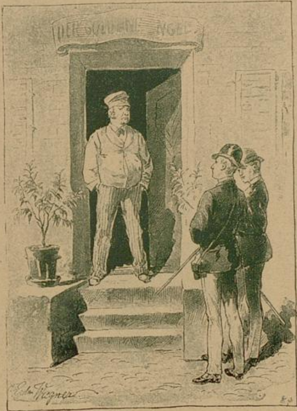
„Machen Sie, daß Sie fortkommen! Scheren Sie sich, ich nehme Sie nicht auf!“

Der Angeredete blickte flüchtig mit geringschätziger Miene auf sie und sah dann, ohne zu antworten, ins Leere. Offenbar war er schon öfter und nicht zu seinem Vortheile von Studenten heimgesucht worden und hielt es deshalb nicht für nötig, die an ihn gerichtete Frage zu beantworten. — Die beiden sahen sich gegenseitig an und lächelten; als aber der „Goldene“ noch