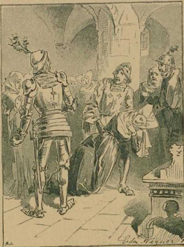
„Laßt's genug sein Eurer Rache, Herr Peter!“

Hagenbach wußte recht gut, daß er hier die Saite nicht zu scharf anziehen durfte, darum gab er vorerst klein bei.