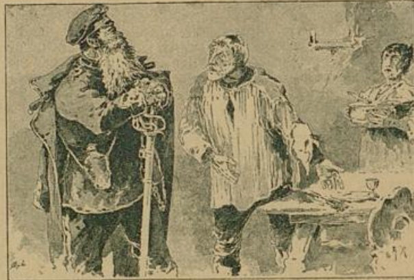
„Passé!“ wettete ihm der Feldwebel grimmig entgegen.

So sprach unser Herr Feldwebel französisch, und war es auch gerade nicht ganz genau nach den Regeln der Grammatik, verstanden wurde es doch überall.