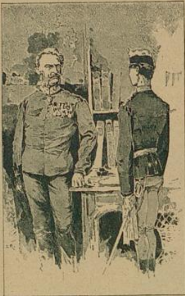
„Excellenz, ich melde mich ganz gehorsamst zu viertägigem Urlaub.“

„Na wie mir da wurde! Ja, läuten hatte ich 'mal was gehört von diesem unglückseligen Paragraph 14, — aber gelesen? Was half's, ich mußte „Ja“ sagen.“