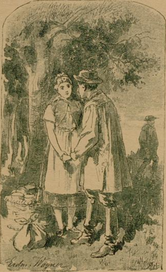
„Das kann ich dir nit versprechen,“ versetzte Gundel freuzergig.

Als die Dirne in das niedrige, höchst sauber ge haltene Stübchen zu ebe ner Erde trat, gab ihr die alte Bauersfrau von oben durch einen Wink zu ver stehen, daß sie recht leise thun möge. Obgleich Gundel vor Schrecken ganz blaß wurde, be herrichte sie sich dennoch und schritt, nachdem sie den Storb behutsam bei seite gestellt und die Schuhe ausgezogen hatte, fast unhörbar an das dicht neben der Thüre zu ihrem kleinen Schlafgemach stehende Bett. Christoph schlief fest, doch sein Atem ging hastig, auf seinen eingefallenen Wangen glühten Fieberrosen. Eine Weile betrachtete das Mädchen angstvoll den geliebten Bruder, dessen kleine verwachsene Gestalt jetzt dem edel geformten Kopf mit der schöngewölbten Stirne und dem blonden Kraushaar keinen Eintrag that, dann bat es die Hausgenossin, ihm zu folgen, und ging mit derselben in die hinter ihrem Stübchen liegende Küche. Als Gundel nach genauer Erkun digung von der alten Frau erfahren hatte, daß Chri stoph erst am Nachmittage heftiges Stechen in der Brust und starkes Fieber bekommen, wurde sie zwar ein wenig ruhiger, aber sie meinte doch, daß es das beste sei, wenn sie sich gleich wieder auf den Weg machen und den Doktor aus Berna rufen würde. Die alte,