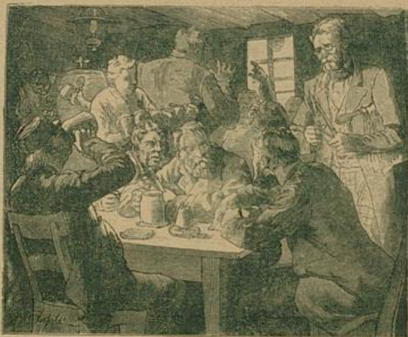
Branntwein, Bier und Apfelwein stoch in Stützen; Lärm und Geschrei ertönte bis spät in die Nacht.

den Haufen erst ein leises Gesumme, dann ein lebhaftes Durcheinandersprechen; allmählich fingen sie an, sich untereinander zu mischen; die Gegner, die sich wochenlang erbittert bekämpft hatten, traten aufeinander zu und fingen an zu unterhandeln, und ehe eine Viertelstunde herum war, hatte sich die Wählererschaft dahin verständigt, den Bach-Müller und den Hann-Martin, die ja doch schwerlich durchzubringen waren, fallen zu lassen und den Ochsenwirt zu wählen. Und so geschah es. Alle strömten aufs Gemeindehaus, und am Abend hatte Schlaubach einen Bürgermeister, an den am Morgen noch niemand gedacht hatte. Als ihm die Menge vor das Haus rückte, um ihm Glück zu wünschen, machte er zwar einige Umstände; er hatte sich aber mit seiner Rede am Morgen über die Einigkeit im Dorf selbst gefangen und fügte sich darum in sein Schicksal. Ein Abend und eine Nacht wie heute hatte der Ort noch nicht erlebt. Der Jubel bei diesem Versöhnungsfeste stieg ins Unglaubliche, zumal der neue Bürgermeister, bei dem die gesamte Wählererschaft zu Gast war, so lange Wein auffahren ließ, als einer trinken wollte. Schon nach wenigen Tagen folgte die