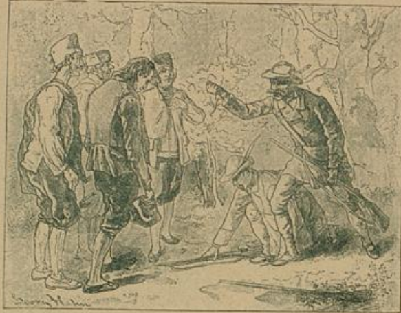
„Halt!“ donnert der Herr Förster, „endlich hab' ich Euch erwischt!“

Triumphierend langte der Hausknecht mit seinem Gefangenen — anders konnte sich Herr Lancelle nicht nennen — daheim an. Der „Goldene Engel“ war, wenn auch nicht golden, so doch ein höchst reinlicher, achtungswerter Gasthof, und achtungswert schien auch der Besitzer desselben, ein großer Mann, der dem Reisenden freundlich, jedoch mit einer gewissen gravitätischen Würde die Hand zum Willkommen bot. — Nachdem