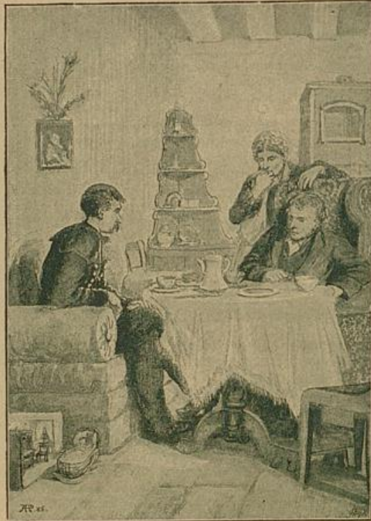
„Dann thut's mir leid, daß ich dir das Herz mit meinem Kummer schwer gemacht habe, aber in der Not —“

Koblau streckt sich, der Hauptstraße nach, in bedeutender Ausdehnung hin, und Eduard mußte es ungefähr seiner ganzen Länge nach durchwandern. Er schlug nicht gleich seinen gewohnten Bergmannsschritt an, in welchem man eine Weile in etwa einer Stunde zurücklegt, sondern schlenderte langsam, blieb oftmals stehen und sah die