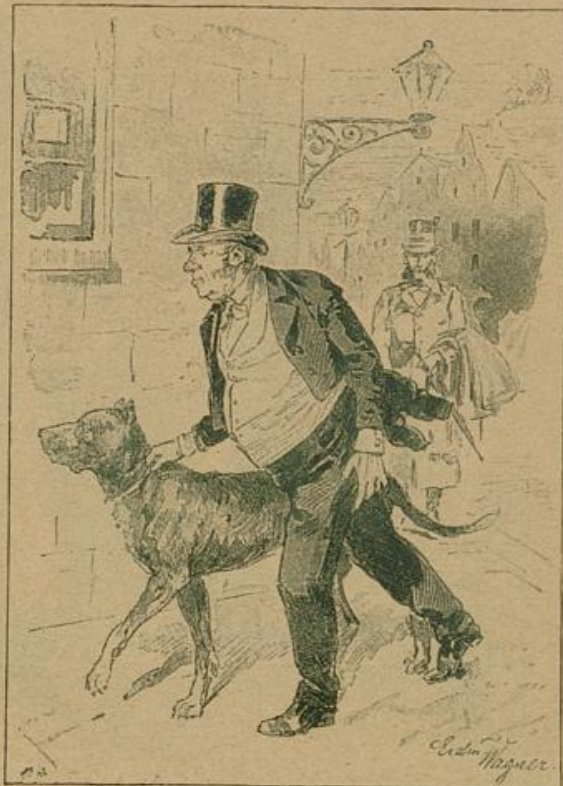
Der Goldene war froh, wenigstens den Hund gerettet zu haben.

„Wohin? zu den Prinzen?“ fragte sie erstaunt. „Nun ja, zu den Prinzen, denen ich Unglücksrump den Eintritt versagt habe. Heiliger Gott, ich bin ein geschlagener Mann, wenn sie mir nicht verzeihen.“ „Aber so erzähle doch, was ist denn passiert?“ „Ach, da ist die Kreide!“ sagte er aufatmend, indem