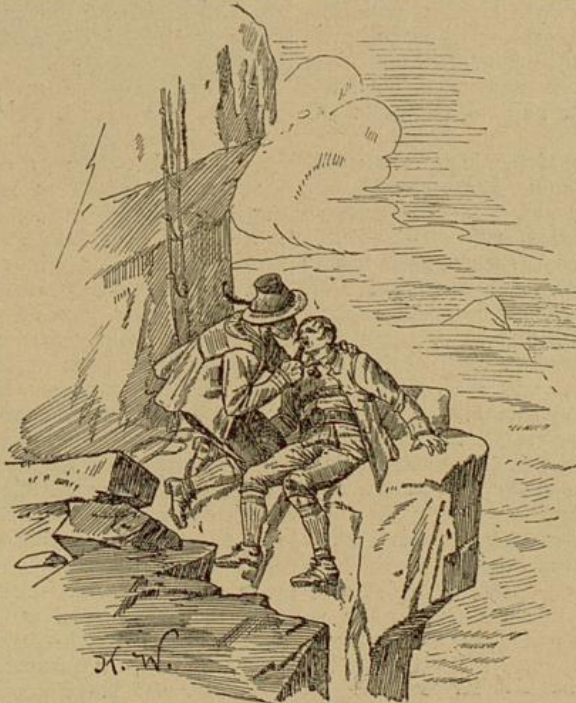
„Wo bin ich?“ fragte er, verwirrt um sich blickend.