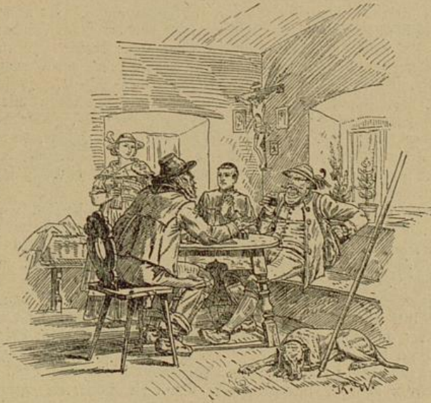
Mit tiefer Bestürzung faltete der Kurat seine Hände vor der Brust.

Die Herren Unternehmer haben nämlich Arbeiterhäuser gebaut, in denen den Arbeitern für wöchentlich zwanzig Kreuzer Zins, der ihnen vom Lohn abgezogen wird, ihre Unterkunft finden. Aber in an jeden Häusl, das nur aus an klein' Vorraum und an einzigen Zimmer besteht, wohnen sechszwanzig Personen bei einand'. Ehepaare mit ihren Kindern und ledige Burschen und Madln — all's bei einand' in einer Stub'n, wie Kraut und Ruabn durcheinand'. In der Fruah, wann man aufsteht, hat's a Lust da drinn', daß man kaum schnau-