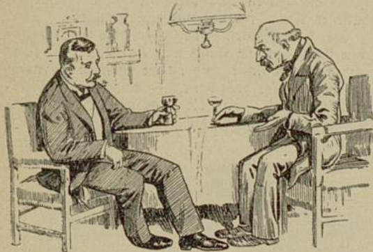
Die beiden Freunde saßen gemütlich bei einem Glase guten Weines beisammen.

Nachdem gegessen war, saßen die beiden Freunde, der Fabrikant und der Arbeiter, gemütlich bei einem Glase guten Weines beisammen und gaben sich gegenseitig ihre Ergebnisse zum besten.