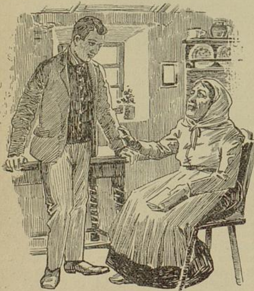
Sonntags streifte er durch Flur und Wald und besuchte auch gelegentlich seine Mutter oder die Zinkenbäuerin.

"Aha," sagten die andern, "der Frieder hat ausgelernt. Das war sein Gesellenstück. Alle Hochachtung!"