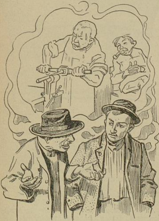
Im Zukunftsstaat darf keiner mehr darben, aber auch keiner schwelgen.

Können und Wissen, ihr Talent und ihre Energie selbstlos ohne materiellen Vorteil, ohne persönliche Vergünstigungen und Auszeichnungen in den Dienst ihrer beschränkten oder faulen Mitbrüder stellen, nur damit die letztern auf Kosten der erstern ein behagliches, müheloses Dasein führen können? Wenn du das glaubst, Citatenfritz, dann kennst du die Menschen nicht, dann kennst du nicht die Macht des Selbsterhaltungstriebes, nicht das Feuer des Ehrgeizes und hast keine Ahnung von den unausrottbaren Wurzeln, die der Egoismus in den Herzen der Menschen immer trieb, gegenwärtig treibt und treiben wird, so lang es Menschen giebt."