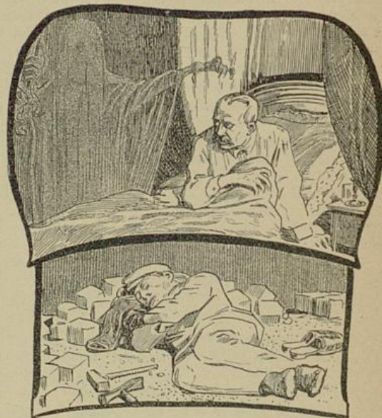
Da schläft ein braver Arbeiter doch süßer auf den harten Steinen als ein Gauner auf seidenerbezogenem Prachtbett.

"Ich glaube und vertraue meinem Stern um so besser," sagte Frieder. "Doch jetzt: Gute Nacht und