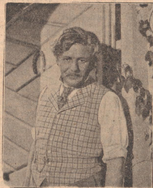
Fiazler Paul Hörbiger