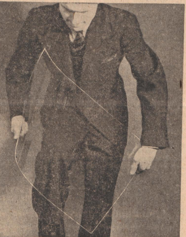
Das Kunstglas läßt sich bearbeiten wie Holz.

sein Brechungsindex beträgt 1,49. Alles in allem: das deutsche Kunstharzglas ist eine Großtat deutschen Erfindungsgeistes.