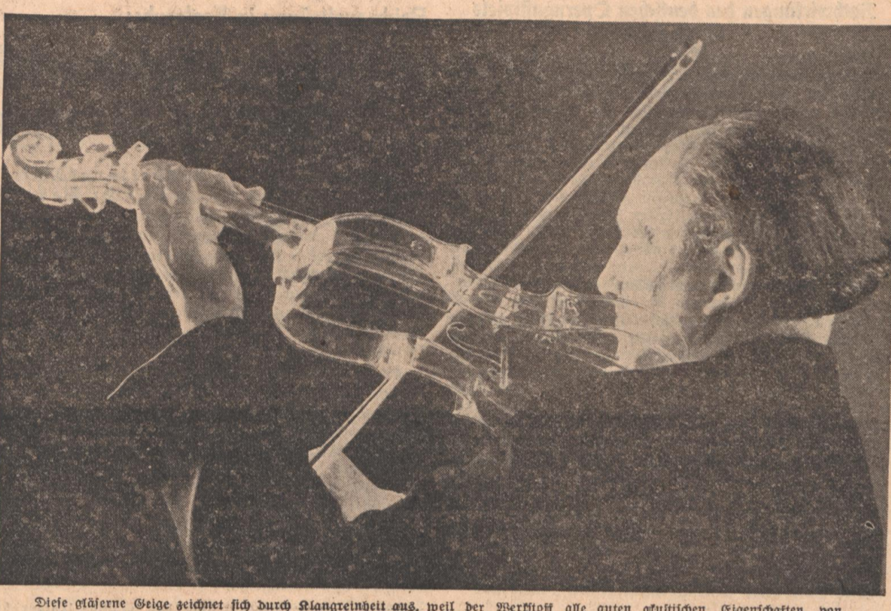
Diese gläserne Geige zeichnet sich durch Klangreinheit aus, weil der Werkstoff alle guten akustischen Eigenschaften von Edelholz besitzt.