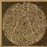
Querschnitt eines gesunden Nervenbündels.

geben Arbeitsfreudigkeit, Energie, Erfolge in Beruf und Leben. Beginnen die Nerven zu versagen, so entschwinden Wohlergehen und Wohlbefinden bald, um der Untätigkeit, Sorgen oder gar Schlimmerem Platz zu machen. — Auf Schwäche und Defekte der Nerven sind auch die meisten körperlichen Leiden zurückzuführen. Man achte deshalb bei der Körperpflege vor allem auf Kräftigung seiner Nerven! Die normale Lebensfunktion des Nervensystems wird hervorgerufen durch eine eigentümliche, in den