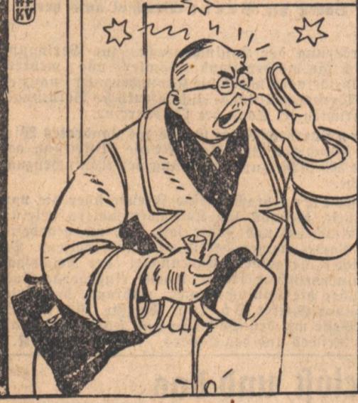
Mutter, rash Effiglaure Lonerde, ich bin im Dunkeln mit Jemandem zusammengelaufen!