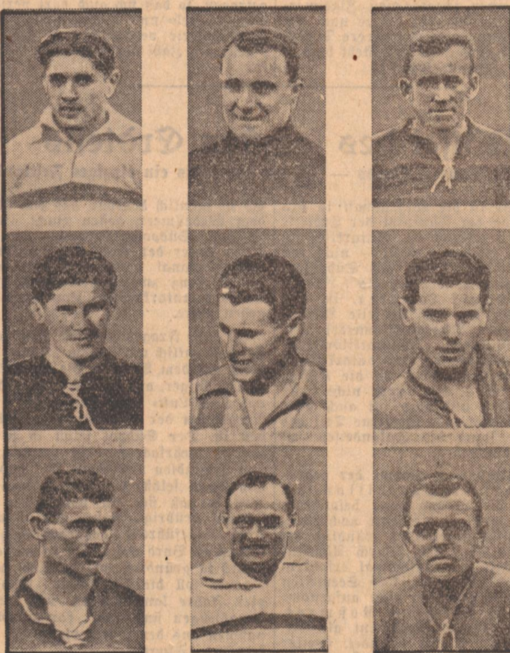
Die ungarischen Fußballer Neun der berühmten Ungarn, die am kommenden Sonntag im Berliner Olympiastadion gegen die deutsche Nationalmannschaft antreten werden...