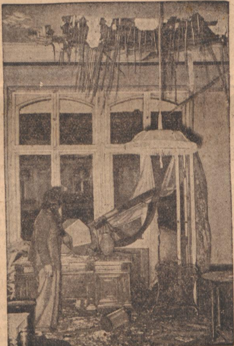
Die Schandtat der britischen Luftpiraten in Berlin

Dieser tapfere Junge hat auf einem deutschen Transporter Dienst als Schiffsdienst und trägt die Auszeichnung als Zeichen seiner Tapferkeit.