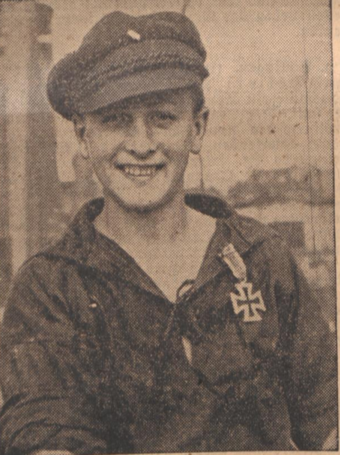
16jähriger Schiffsjunge erhält das Eiserne Kreuz

* Neuport, 11. Sept. In der Neuportor Montanabörse waren starke Kursstürze zu verzeichnen, die die Gewinne der Vormoche völlig auslöschten. Insbesondere hatten die Kupfer- und Zinkwerte bei mäßigen Umsätzen starke Verluste. In Neuport erklärt man diese starken Kursstürze mit den steigenden Zweifel, die die U.S.A.-Wirtschaftskreise an der Fähigkeit Englands zum Durchhalten der wichtigen deutschen Angriffe haben.