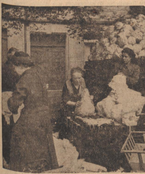
Auf den Wochenmärkten der Stadt wird zur Zeit allenthalben das Filderkraut eingeschnitten.