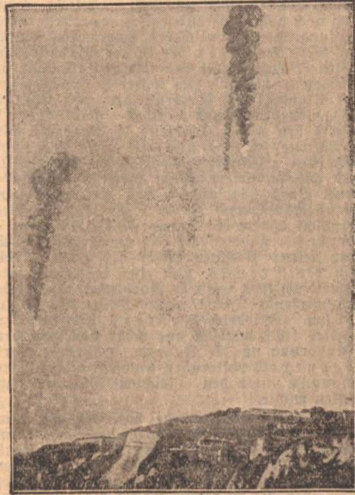
Englische Sperrballone stürzen brennend in die Tiefe

Besichtigend, ihnen wichtige Anhaltspunkte haben die Engländer bemerkt mit Luftbomben beschießen. Aber auch diese sind ein beliebiges Ziel unserer Angriffe, insbesondere der Jäger.