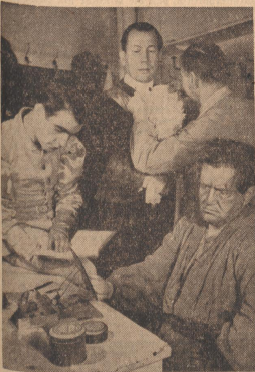
Nach den Sommerferien öffnete das Staatstheater wieder seine Pforten. Unser Bild zeigt einen Blick hinter die Kulissen, wo die Künstler ihre letzten Vorbereitungen vor dem Auftritt treffen.