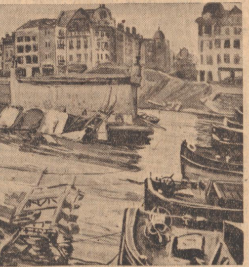
Ein Bild aus der Vollbehr-Schau

Unwillkürlich widmen wir der Betrachtung der badischen Strombilder von Reich und den getarnten Rheinbuntern mehr Zeit. Anschließend erleben wir eine Betonung bei Tag und Nacht, an einem hochgelegenen Kampfbauwerk, wobei Vollbehr befragt, wie ralt, trotz feindlichen Feuers von den Baukompanien gearbeitet wurde. Einmal hat er vor der Fortschrittsfeste, drei Tage vor der Einmündung des französischen Maimont ins Bild gebracht, ein andermal malte er durch Scherenschnitt die feindliche Bilde von Reich. Einem Begriffe von der Wucht des deutschen Angriffs geben die Bombenwolken der Düntrich, und wie ein japanischer Holzschmitt, so feintönig wirken die „Fanzesfeier“. Eine Gruppe gilt dem Feldzuge gegen England; es sind die feindlichen Kampfpläne um das Kap Gris Nez, an der engsten Stelle zwischen der Insel und dem Festland. Ferriede, Befehlsvorort, Befehlsstellen, Anführer von Doren und Rotterdam, sowie ein Bild auf den ehemals hart umkämpften Bultsaute-Vogel ergänzen diese kleine Bilderfolge. Ihr sind noch sechs neue Raumbilder einer Bombenfabrik anzufügen, wo am laufenden Band in unheimlicher Zahl, Tag für Tag jene Wurfgeschosse herbeigeleitet