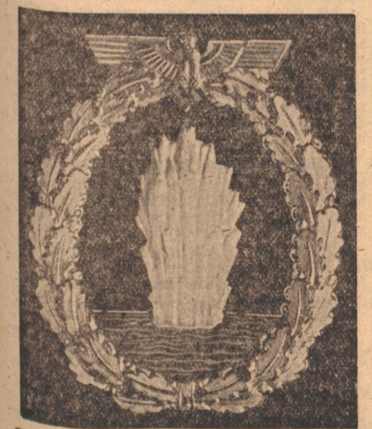
Neues Kriegszusatzzeichen für die Befehlungen von Minenjäger, Unterseebootjäger und Sicherungsverbänden

Der Oberbefehlshaber der Kriegsmarine, Großadmiral Er. v. Raeder, hat durch einen neuen Erlass ein neues Zusatzzeichen für die erfolgreiche Tätigkeit der U-Bootjäger gegen feindliche Unterseeboote, Minensucher und U-Boote beschlossen.