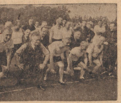
Ein Schnappschuß vom Sporttag der Betriebe auf dem Hochschulstadion. Auch die „Alten“ waren kräftig mit von der Partie.

Rheinwasserstände vom 5. Oktober Konstanz 428 (-2), Rheinfelden 380 (-8), Breisach 318 (-24), Rchl 402 (-9), Straßburg 385 (-15), Karlsruhe-Marau 582 (-23), Mannheim 542 (-29), Camb 411 (-29).