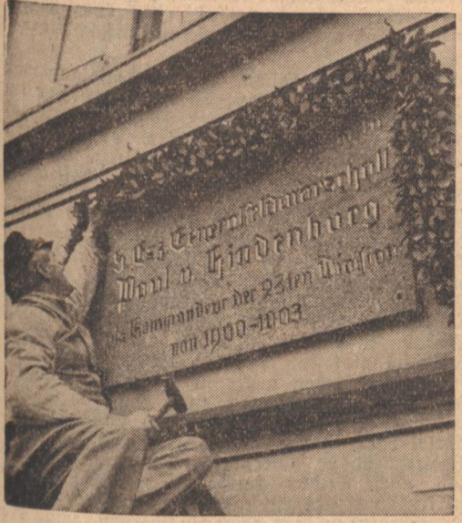
Zum 2. Oktober, dem Geburtstage Hindenburgs, wurde die Gedenktafel am Hause Kaiserstraße 184, wo der verstorbene Generalfeldmarschall einst als Kommandeur der 23. Division (1900-1903) gewohnt hat, im Auftrag der Stadtverwaltung mit Lorbeer geschmückt.