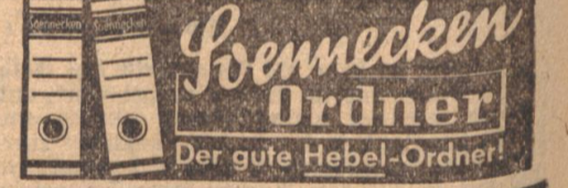
Der gute Hebel-Ordner