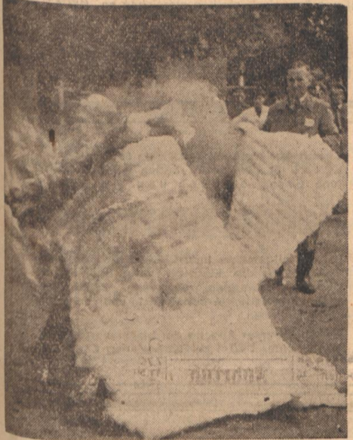
Neues Lösungsverfahren mit Glas Geoponneses Glas, sogenannte Glasfaser, lose oder zu Decken verarbeitet, ist ein geeignetes Mittel, um Entstehungsbrände wirksam zu bekämpfen. Unser Bild zeigt eine Feuerbekämpfung mit diesem Werkstoff, die dieser Tage auf dem Hochschulgelände erprobt wurde.