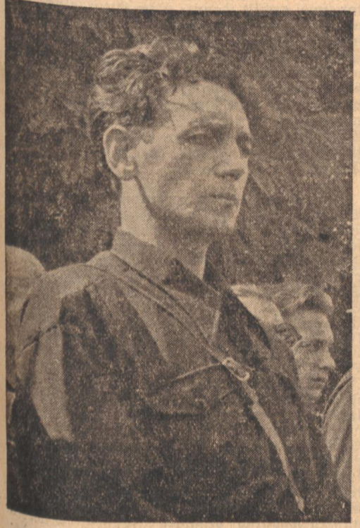
Horia Sima (Archivbild)

Der Kapitän hatte Sima selbst zu seinem Nachfolger bestimmt, und als Codreanu im November 1938 ermordet wurde, übernahm Sima