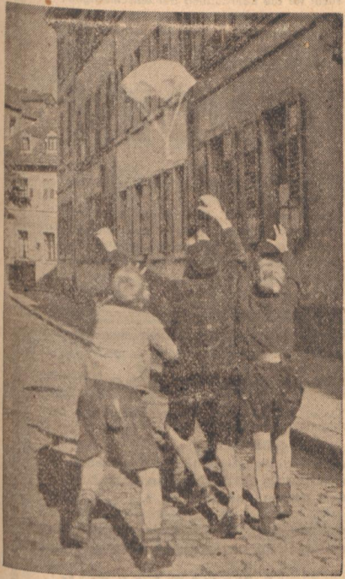
Fallschirmjäger in der Altstadt Die Besetzung der Karlsruher Jungen für unsere Flieger und Fallschirmjäger ist groß. In der Altstadt ist Fallschirmhochwert und Auffangen das Spiel des Tages.