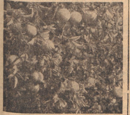
Dortheim möcht ich zieh'n... wo in Karlsruhe die Zitronen blüh'n. In der Kriegsstraße 156 blühen sie zwar nicht mehr, aber ausgewachsene, wunderbar gelb in der Sonne leuchtende Früchte sind dort im Vorgarten zu sehen.