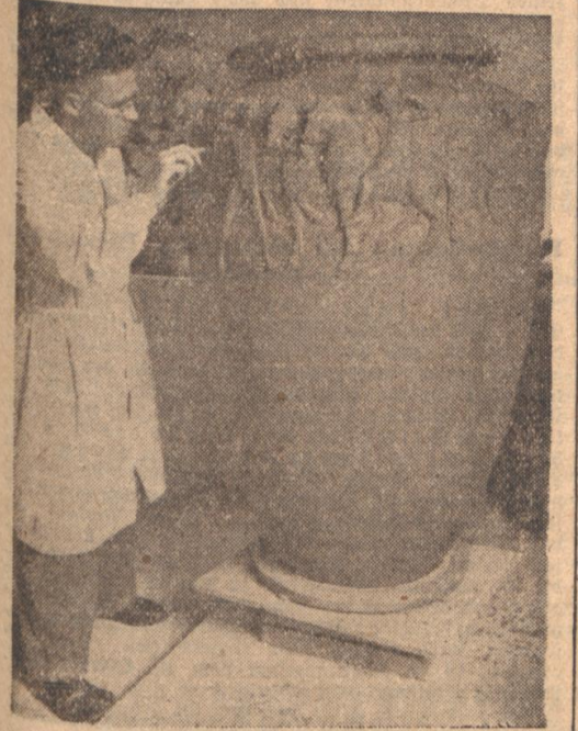
Riesenvase aus der Majolika Für die dekorative Ausgestaltung von Großräumen werden in der hiesigen Majolik-Manufaktur Vasen in außergewöhnlich großen Ausmaßen hergestellt.