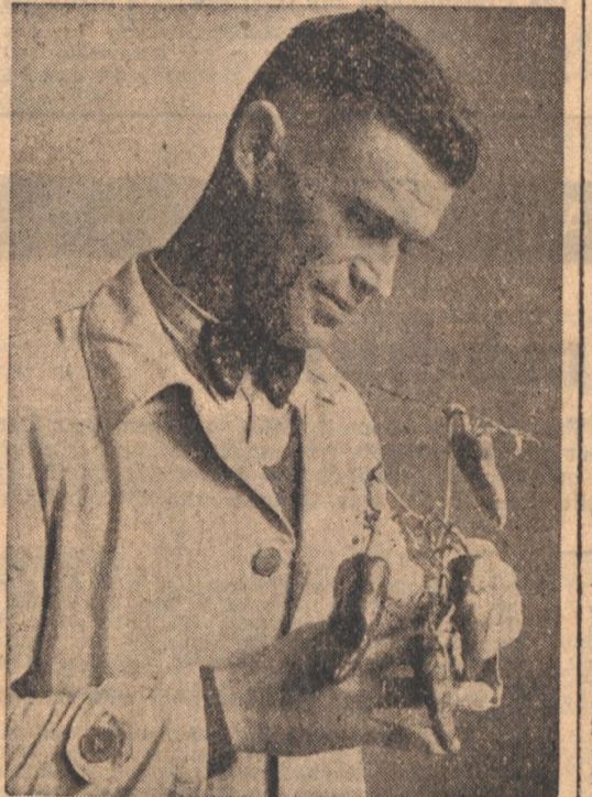
So sehen die Paprikaschoten aus Aufs.: „Führer“-Geschwindner, Zircher (I)

Nachtschattengewächse mit roten Schoten. Ueberhaupt man von weitem das Feld, könnte man meinen, Kartoffelplanzen vor sich zu sehen, und in der Tat gehören die Paprikapflanzen zur Familie der Nachtschattengewächse.