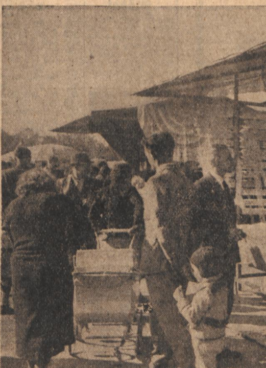
Gestern nachmittag wurde unter reger Beteiligung des Publikums der Karlsruher Herbstmarkt eröffnet. Blick auf die Verkaufsmesse auf dem Marktplatz.

Blick vom Turmberg. Unter den ältesten Mitgliedern unserer Gemeinde hat sich der Tod in den letzten Tagen zeigte.