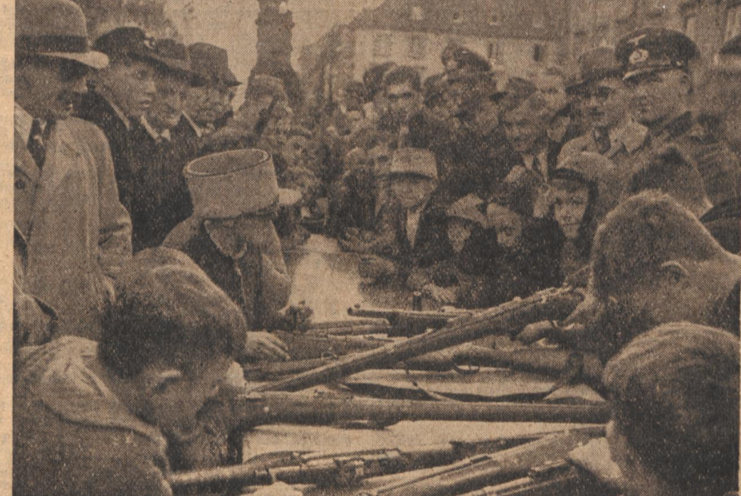
Bei der gestrigen von der DAF. durchgeführten Straßensammlung für das WHW. fanden die auf dem Adolf-Hitler-Platz ausgestellten Beutestücke aus dem Krieg gegen Frankreich lebhaftes Interesse.