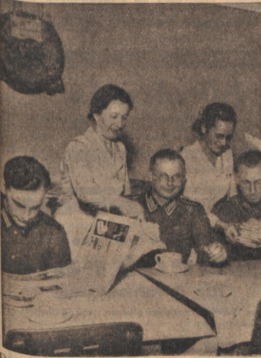
Durchreisende Soldaten werden täglich in der Kaffeestube des Hauptbahnhofes, die dem Bahnhofs-offizier untersteht, von Frauen der NS-Frauen-schaft freundlich bewirtet.