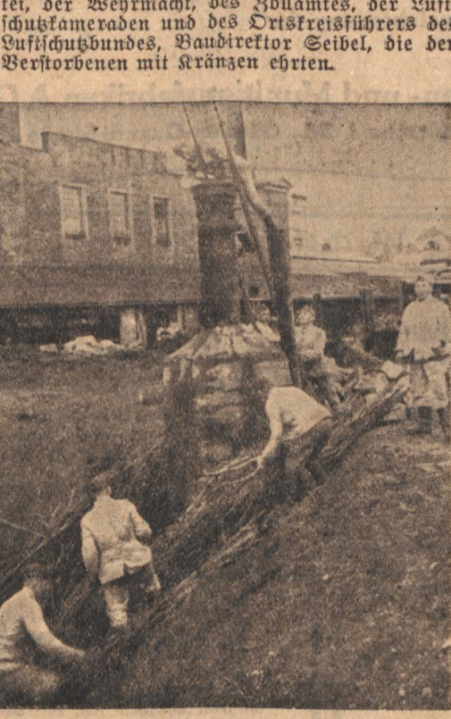
Pioniere sprengten aus früherer Zeit übrig ge-bliebene Fundamente beim alten Gaswerk in der Kaiserallee. Ein alter Kamin wird zur Sprengung vorbereitet.

h. Wollfartsweiser. Unsere Volksschüler e-wieder eröffnet. Eine reiche Auswahl von 300 Büchern liegt unseren eifrigen Lesern zur Ver-fügung. Eine Anzahl neu bestellter Bücher wird demnächst eintreffen und wird unseren Bestand bedeutend erhöhen. Jedem der Freude und Interesse am Lesen eines guten Buches hat, steht unsere Volksschule zur Verfügung. Die Leihgebühr ist so gering, daß die Teil-nahme bestimmt jedem möglich sein wird. Zwei Pfennig Gebühr für ein Buch und 14 Tage der Entlehnung ist keine Ausgabe.