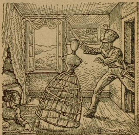
Mit einem furchtbaren Fluch schlug er darauf los.

Da — was war das? Neben ihm ertönte die sanfte Stimme Christianes: