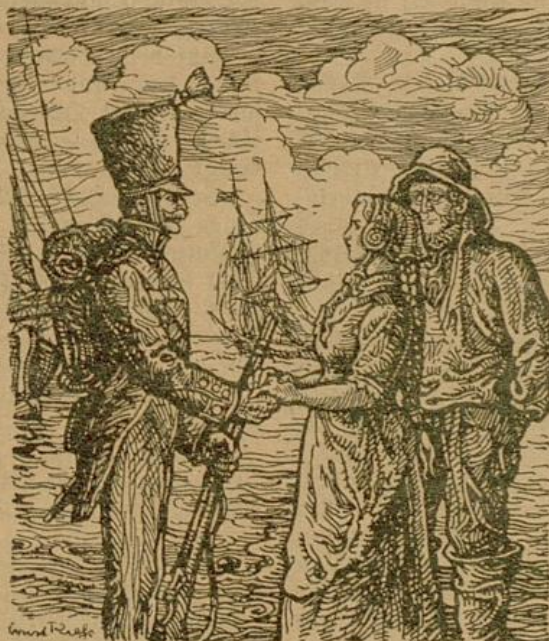
„Dat dhu it gern“, versicherte Niets, und wenn der alte Fischer nicht dabei gestanden hätte, so hätte sie ihn zum Abschied geküßt.

Im Untergehoß des Hauses war das Lädchen eines kleinen Spezereikrämers, der jede Woche zum Freitag, dem kirchlichen Fasttag, eine Sendung Sprotten und Büdlinge von der Wasserkante erhielt. Das war immer ein stilles Fest für den Einäugigen. Mit sehnsüchtigem Behagen sog er den Geruch der geräucherten Seefische ein, der durch das Haus siderte, die Treppe hinaufstach und ihm um die Nase streifte. Dann saß er am Fenster, schaute