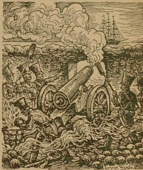
Mit gewaltigem Krachen schlug der glühende Achtzehnpfünder dem „Christian VIII.“ in die hölzernen Planken.