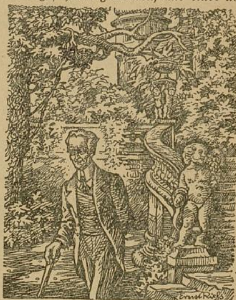
Der Umgebung entrückt, geht er durch den verwilderten Park.

hergleiten. Außerlich und innerlich verfällt alles. Seit Jahren ist er nun gänzlich allein, immer enger war der Kreis der Lebensgefährten geworden, und einer nach