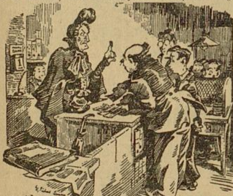
„Aha!“ sagte die Ahnfrau mit grimmiger Befriedigung.

Der Direktor klimperte nachdenklich mit dem Gelde, das er nach liederlicher Groß-