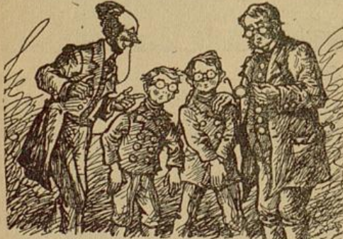
Der Optiker, vergnügt, auf einmal ein so gutes Geschäft zu machen, probierte mit den Enkeln sogleich ein halbes Dutzend Brillen.

Großvater Stiefelnagel vom Kleinhofe in Brakenfelde hatte schon immer den Wunsch gehabt, eine Brille zu tragen, zumal in dieser argen Kriegszeit, wo es ohne ihn gar nicht ging. Doch seine Augen waren so gut, daß er Linfen und Bohnen voneinander unterscheiden konnte wie nur einer, ja, jeden Satz in der Zeitung ohne Stocken zu lesen vermochte, ob es große oder kleine Schrift war. Und so hatte er eigentlich keinen zwingenden