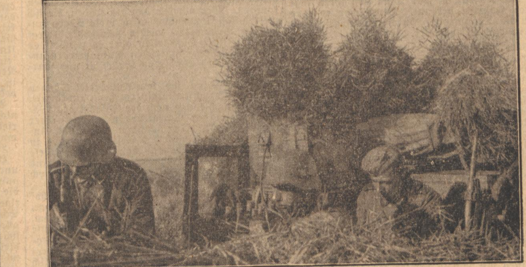
Meldungen treffen im Funkwagen ein. Der Kampf um ein Dorf ist im vollen Gange. Während des Gefechts treffen im gutgetarnten Funkwagen Nachrichten ein...