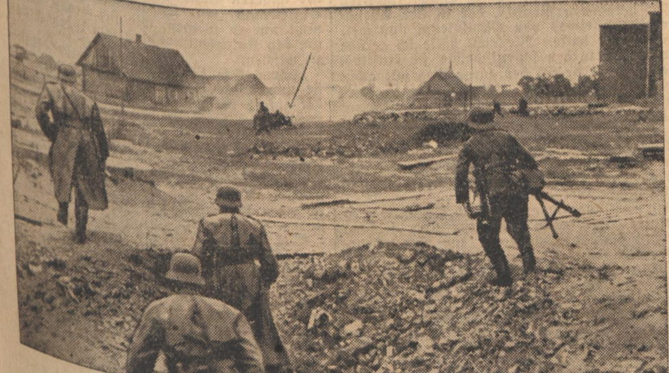
Pak im Einsatz gegen Sowjetpanzer. Die Panzergefahr ist beseitigt. Die Männer des Sturmtrupps ist die Bahn frei.