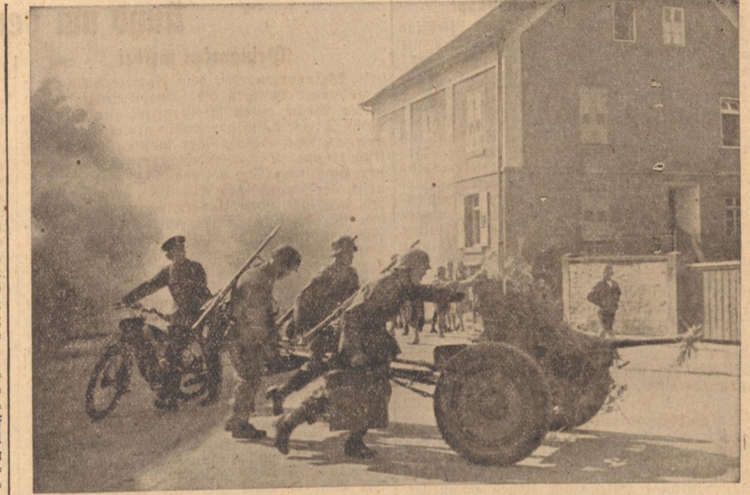
Rote Pak verfolgt die sich zurückziehenden blauen Sicherungskräfte.

Weiter drängt Rot nach. Den Männern stehen die Breden vor. Die Offiziere stoßen. Nur jetzt nicht locker lassen... Karlsruher Soldaten zeigten in einer Standortübung, was sie können