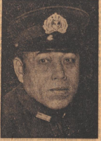
Admiral Yamamoto

späterer Chef der Marineflieger der Japans Streikräfte die Grundlage für ihre späteren großartigen Erfolge gegen Amerikaner und Engländer gab. Bei der großen Parade 1940 in Yokohama anlässlich des 2600jährigen Jubiläums des japanischen Reiches dirigierte der Oberbefehlshaber der gesamten Flotte seine Einheiten so vorrefflich, wie die Götter seines eigenen Leibes. Zweimal wurde Yamamoto während dieses Krieges durch kaiserliches Lob ausgezeichnet. geb.: Robert Wagner, Gauleiter.