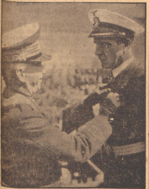
Italiensche Ehrung für deutschen Ritterkreuzträger...