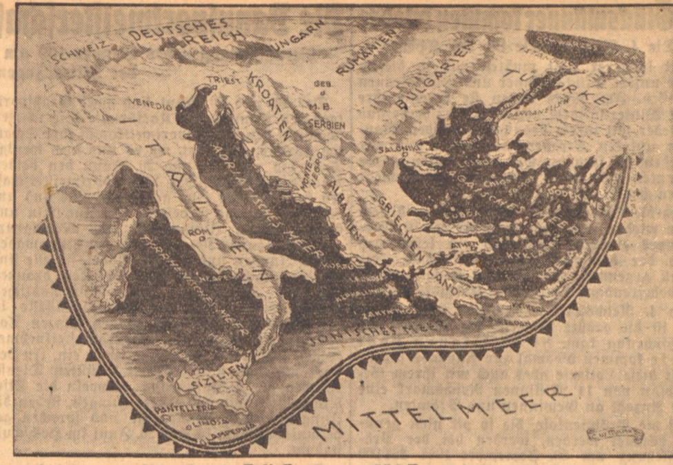
Reliefkarte von Süd-Europa

(PK-Zeichnung: H-Kriegsberichter Buschschulte, Waffen-H Z.)