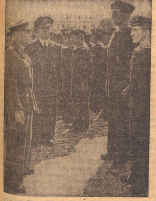
Zwei Meter, Herr Admiral! Beim Abschreiten der angetretenen Besatzungen...