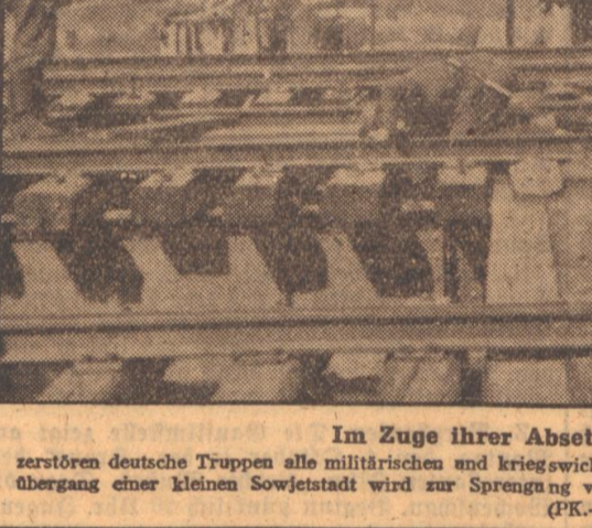
Im Zuge ihrer Absatzbewegungen zerstören deutsche Truppen alle militärischen und kriegswichtigen Anlagen...