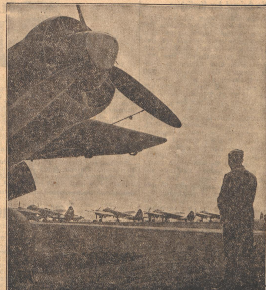
Die deutsche Luftwaffe, die in den letzten Jahren aus dem Nichts entstanden ist und zu einer der mächtigsten Waffen im Ringen um Deutschlands Freiheit geworden ist, wird bei den kommenden Entscheidungskämpfen wieder eine bedeutende Rolle spielen.

fest betrachten, vergehen wir fast, daß wir so viele 100 Kilometer fern der Küste sind. Denn das Bild des Krieges hier ist fast das gleiche des Erdkrieges. Vom offenen Deckrand aus sehe ich es nicht nur, sondern ich merke auch, wie die Luft jetzt nach Pulver und Rauch riecht und wie die ganze Atmosphäre davon erfüllt ist. Darin dröhnen die Motoren. Nur daß die Wogen sich rauh wieder glätten, wenn die Geschosse sie aufgewühlt haben.