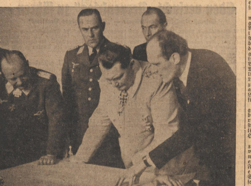
Der Reichsmarschall bei Messerschmitt. Reichsmarschall Göring besuchte auf seiner Besichtigungsfahrt durch Süd-Deutschland die Werke der Messerschmitt-A.G. und ihre Anlagen...