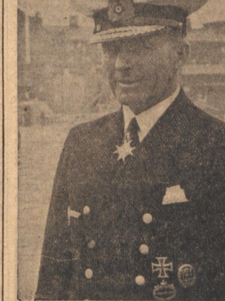
Admiral Arnould de la Perière. Der Marinebefehlshaber im besetzten Gebiet, Vizeadmiral Lothar von Arnould de la Perière, Ritter des Ordens Pour le mérite, ist tödlich verunglückt.