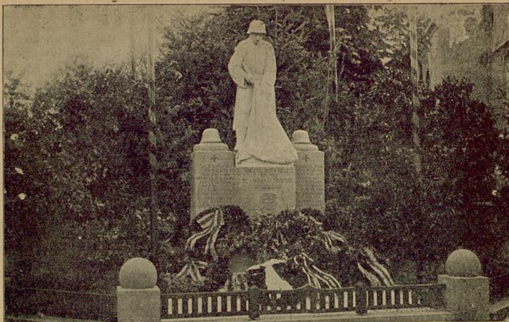
Kriegerdenkmal in Griesheim (Amt Offenburg)

Referenzen: Urloffen, Griesheim, Nordrach, Seebach, Grafenhausen u. a. m.