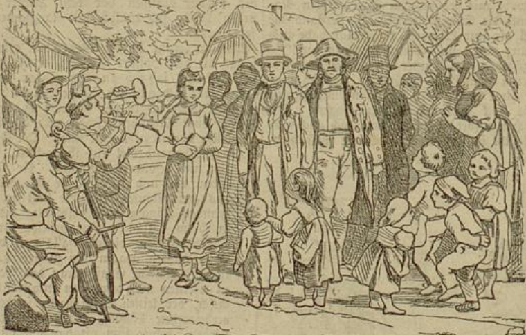
Ueber vier Wochen war Hochzeit.

eisen auf der Wäsche stehen und flog dem unter der Thüre Stehenden entgegen. Er empfing sie mit offenen Armen. „Ist es denn wahr?“ rief er, „hast mich also doch gerne und magst mich, so wilst wie ich jetzt bin?“ — „Magst denn du mich noch?“ fragte das Mädchen verschämt und liebevoll zu ihm hinauf sehend. Die Antwort gab er ihr nicht in Worten.