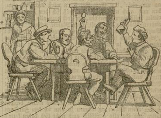
That übertrieben toll und lustig und trank sich einen tüchtigen Rausch an.

Aber wie stand es mit dem Franz? Nachdem er noch ein paar Stunden einsam in Feld und Wald herum gelaufen war und die Geschichte zu verwinden versuchte, ging er in das Wirthshaus, that übertrieben toll und lustig und trank sich einen tüchtigen Rausch. Das war ganz wider seine Gewohnheit, nicht gerade aus großer Tugend, sondern es ging ihm wie dem Kater in der Fabel; er hatte eine angeborene Abneigung gegen Wein und Bier und wenn er diese bezwang, manchmal um der Neckerieien der andern Burschen willen, so bekam es ihm so schlecht, daß er mit Widerwillen nachher „pui Teufel!“ sagte, und es nicht