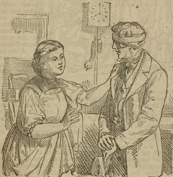
„Käthe, bin ich dir jetzt noch zu schön?"

Im Dorfe ging Alles seinen ruhigen, gewohnten Gang. Die Käthe, die gar still und ernsthaft geworden war, hatte ihrem Vater ehrlich gesagt, daß der Franz zum Abschied an ihrem Fenster gewesen und um was er sie gebeten habe. Darauf ging der Schulmeister eines Sonntags zum Schulzen und die beiden Alten machten miteinander aus, daß der Schulmeister alle Wochen zweimal und auch sonst, wenn er wollte, des Abends zum Schulzen kommen sollte. Das hielt er denn auch getreulich, wie eine Pflicht, las die Zeitung vor, bekam nebenher ein gutes Glas Wein und