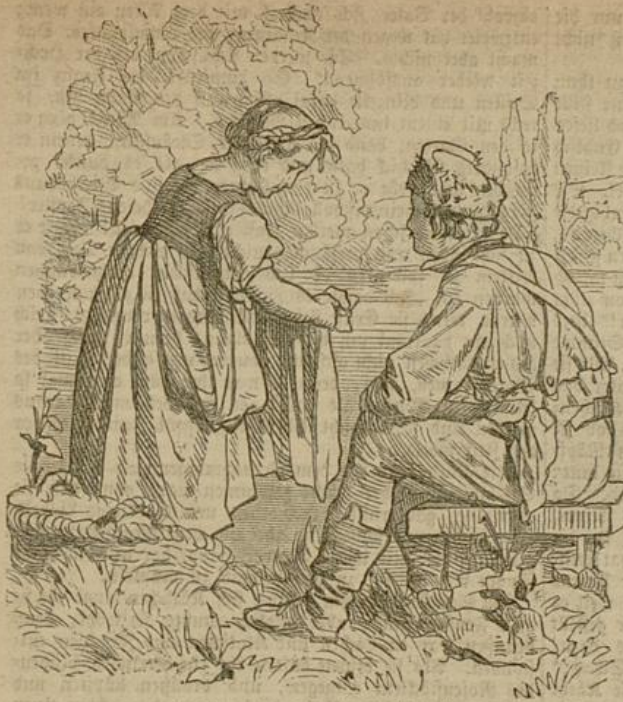
Das war nun gar kaum zum Aushalten.

vertreibt?" — „Hab' keinen Schatz!“ sagte Käthe mit gezerrter Stirne. — „Ja, ja!“ lachte der Franz, „das wollt ihr Mädels nicht eingesehen und schämt euch dessen, wenn ihr es schon gerne haben möget!“ Da richtete sich Käthe plötzlich hoch auf, so daß sie ordentlich groß aussah, ihre Wangen waren glühend roth, und aus ihren schönen, sonst recht sanften Augen fuhr ein stolzer Blick auf ihn, indem sie ernsthaft und fest sagte: „Wenn ich einen Schatz hätte, so müßte es einer sein, dessen ich mich nicht zu schämen hätte und der sich meiner nicht schämte!“ Dann fuhr sie wieder eifrig in ihrem Geschäft fort.