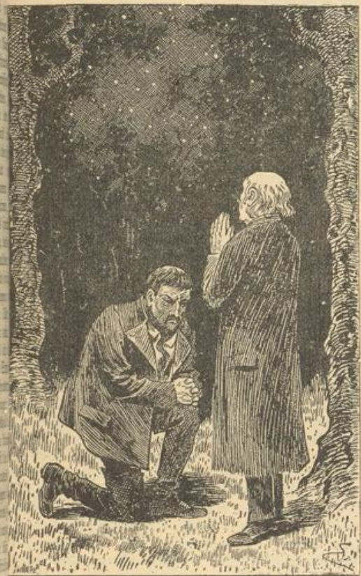
er alte Geistliche entblößte sein Haupt und verrichtete ein stummes Gebet.

ch die herrlichste Kuppel, die je ein Gotteshaus in eigen nannte, der weite, schimmernde Sternenzimm, in unendlicher Pracht und Klarheit wölbte. Und durch die herbstlichen Zweige strich das leise Säuseln des Windes wie weltensferner Orgelklang . . . In stillschweigendem Einverständnis machten sich die beiden Männer dann auf den Weg, dem Städten entgegen. Während ihrer ganzen Wanderung rachen sie kein Wort. Dort nur, wo wenige hundert Schritte vor dem Stadthor sich von der Hauptstraße ein Pfad abzweigt, der außer zu einigen irdenen ausgebauten Gehöften auch zur „Burg des