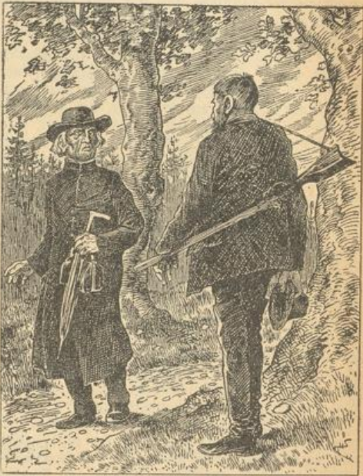
„Guten Tag, Herr Prediger! Verzeihen Sie, wenn ich Sie erschreckt habe.“

„Die Menschen reden viel, was sie nicht verantworten können. Ich aber, als Seelsorger, meine, über Ihre Frau ist ganz gewiß nicht Klage zu führen. Seit das war, daß Sie damals den armen Forstgehilfen entzweigeshossen haben, ist Ihre Frau eine eifrige Kirchengängerin geworden, und sie hat auch die Kinder taufen lassen.“