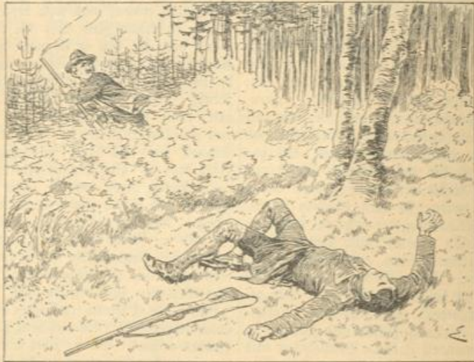
Einem Augenblick später wälzt sich die grüne Gestalt des Forstgehilfen distend im Kreise.