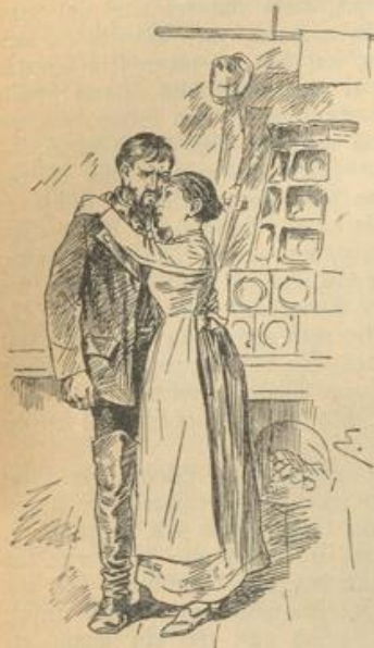
„Franz, hab' ich dich denn endlich wieder?“

Frau Klara war aufgestanden. Nun eilte sie mit zwei schnellen Schritten auf ihren Gatten zu und warf sich an seine Brust: „Franz, du Lieber, du Guter, hab' ich dich denn endlich wieder?“