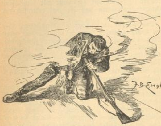
Ein Knall durchschallte tragend das Haus.

Da kniete auch Bandel neben seinem Todfeind nieder, um mit kundigem Blicke zu sehen, ob vielleicht noch Rettung möglich wäre; aber er gewahrte bald, daß die Kugel in die Herzgrube gedrungen und jede Rettung unmöglich war . . .