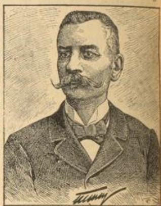
Peter I., König von Serbien.

Eine Anzahl verschworener Offiziere schlachtete in der Nacht vom 10. zum 11. Juni auf grauenhafte Weise den König Alexander und die „Königin“ Draga ab. Mitten in der