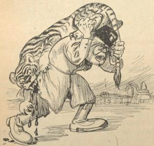
Einen Tiger stellen ist nicht leicht.

durch den Erzbischof von Canterbury. Der König wird aber dadurch nicht besser geworden sein, und sein Chamberlain auch nicht. Dieser ist heute in der Politik der ausschlaggebende Mann. Und wenn man auch nicht weiß, wieviel Hirn er hat, so weiß man doch, welche Stirn er hat. Nachdem er das arme Burenvölkchen ruiniert, der Freiheit beraubt, wohl auch beim Friedensschluß übers Ohr gehauen hat, reißt er ins verdödete Land und hält dort maufige Reden. Die ehrlichen Buren haben ihn wieder mit ganzer Haut herausgelassen; zum Dank dafür, daß er die Burenführer Botha, Delarey und Dewet in England mit kühlen Worten abspießte, als sie die Not ihres Volkes darstellten und flehentlich, um Hilfe baten. Nicht einmal das haben die Engländer leiden wollen, daß die verzweifeltsten Buren sich an die ganze Kulturwelt um Erbarmen und Geld wandten. Man wagte selbst in Berlin nicht, diese Helden offiziell zu empfangen, solch einen Schrecken hat man vor Chamberlain! Nun, nach dem alten Nürnberger Stadtrecht muß immer der die Prügel behalten, der sie empfangen hat. Aber eine Gerechtigkeit gibt's doch noch in der Welt; das werden auch die Engländer einst erfahren. Nun wüten sie aber gegen uns. Es ist recht englisch, wenn ihr Dichter Rudyard Kipling uns Schwindler ohne Scham und