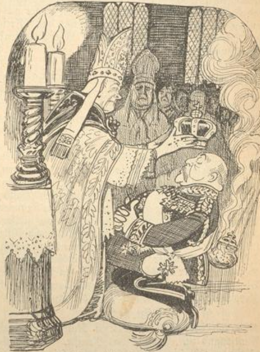
England hat im August seinen König Eduard VII. unter Entfaltung der alten, feierlich düsteren Pracht gekrönt durch den Erzbischof von Canterbury.

o du schönes, armes Land! Was soll der Hinkende von dir Neues berichten? Es ist ja doch wieder das alte Elend. Dich haben sie sicher in den Krallen,