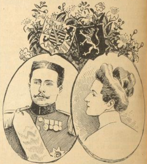
Großherzog Wilhelm Ernst und Großherzogin Karoline von Sachsen-Weimar-Eisenach.

erhielt eine Landesmutter in der Person der Prinzessin Karoline von Neuß. Obwohl sie der bekannten älteren Linie der Beherrscher aller Neußen entstammt, ist sie doch noch sehr jung. Und obwohl diese ältere