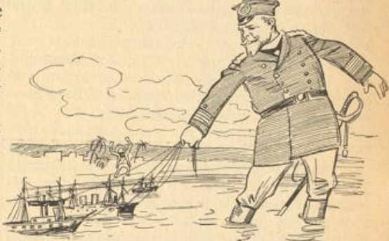
Die venezolanische „Flotte“ wurde eins zwei drei weggenommen.

Fort auf uns Feuer gab, ward es in Grund und Erdsboden geschossen. Darüber nun spitzten die Amerikaner die Ohren. Das wollen sie nicht leiden, daß in ihre Nachbarschaft ein fremder Hahn kommt, und der amerikanische Gesandte Bowen machte den Engländern und den Deutschen so viele Schwierigkeiten, daß der Präsident Castro sehr ungeschlagen davonkam und die Sache erst noch vor das Haager Schiedsgericht bringen darf! Der von uns weggenommene Dampfer Restaurador mußte zurückgegeben werden; die biedern Venezolaner und ihr ehrenwerter Präsident erkannten das Schiff gar nicht mehr und wagten es auch zuerst nicht mit den Füßen zu betreten, so sauber hatten es die Deutschen inzwischen gepuzt. Nicht eine einzige Laus war mehr zu sehen. Die gelben Kerle konnten's anfangs kaum aushalten vor