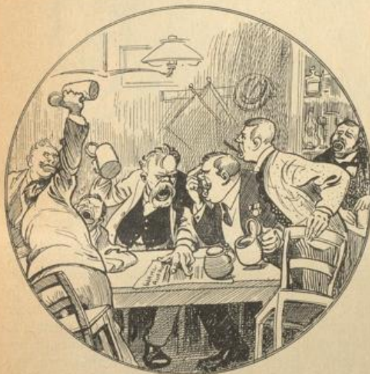
Die Reichstagswahlen dieses Sommers bringen in manchen Wirtshäusern auch Niederschläge und Hagel.

Und da die Wahlen gerade alles in Aufruhr gebracht haben, sagen wir ein Wörtlein vom verfloffenen Reichstag. Ja, es hat manchen wunder genommen, was die da in Berlin noch machen werden mit dem Zollgesetz. Aber eigentlich aufgeregt hat sich das Volk im großen und ganzen darüber nicht. Der Hintende möchte einmal in einem Wirtshaus, wo viel politisiert wird, sei es in Stadt oder Land, umfragen, um wieviel und auf wieviel nun in Wirklichkeit der Zoll für Getreide und andere wichtige Dinge erhöht wurde? Auch unter Sozialdemokraten möchte er fragen. Wieviel werden ihm die richtige Antwort geben können? Wie schrie der Petersepp im Löwen? „Wir wollen's haben, wie sie's im Württembergischen haben.“ Und als der Sekretär aus dem