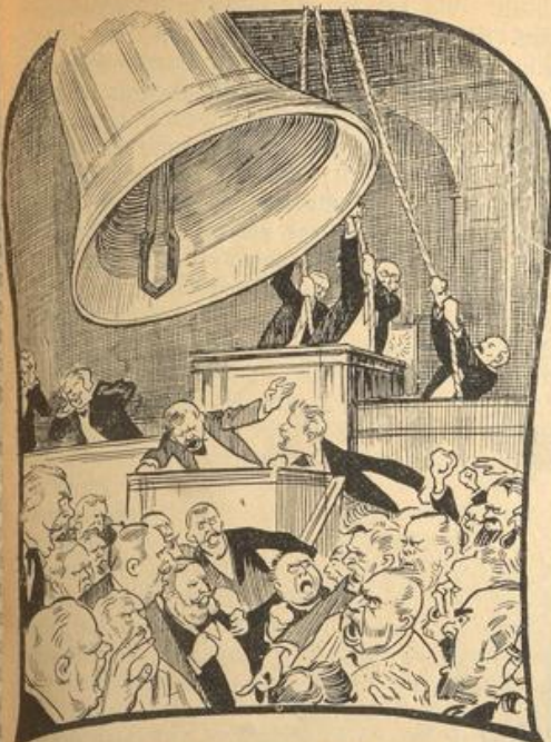
Man muß wohl im Reichstagsaal noch eine Münsterlocke aufhängen.