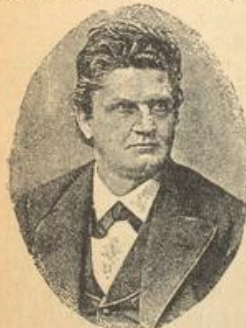
Ministerpräsident Rott †.

haben wir leider die gleichen Schmerzen wie andere im lieben deutschen Vaterland: die Schwarzen. Nun wollen sie auch bei uns endlich wieder Klöster erzwingen, und es schien eine Zeit lang, als ob das Ministerium von Dusch vielleicht nachgeben wollte.