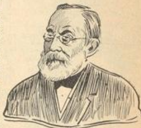
Professor Virchow †.

ßen nationalliberalen Partei, im Abgeordnetenhaus längere Zeit Präsident, tat er dem Deutschen Reich und Bismarck uneigennützig die größten Dienste. Charaktervoll, fromm und treu, schlug er sogar den Ministerstuhl aus, weil er fühlte, daß er doch nicht regieren durfte, wie es sein politisches und männliches Gewissen ihm befahl. Andere haben es schon anders zu machen gewußt. Bennigsen aber ist einer der treuen Männer, und nur solche können Großes wirken. Groß ist auch der verstorbene Virchow gewesen in der Medizin, der Größten einer, die je gelebt haben; aber in der Politik so klein wie die Trichinen, die er bekämpfte. Er hat das unsterbliche Verdienst, kurz vor dem französischen Kriege die Abrüstung des Heeres zu beantragen. Wenn das nicht echt freisinnig-schildbürgerlich war, so will der Hintende nichts gesagt haben. Auch der berühmte freisinnige Rickert ist gestorben. Er war in seinen alten Tagen etwas vernünftiger geworden und hatte sich deshalb von dem wilden Eugeu getrennt. Einen merkwürdigen Tod hatte der deutsche Reichskanonikus Friedrich Alfred Krupp. Viel Geld und Gut tut nicht immer gut. Das hat man auch in