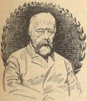
Rudolf von Bennigsen †.

Überhaupt ist die preukische Regierung nicht auf Rosen gebettet. Die Polacken machen ihr heiß. Sie sind fruchtbar wie Kaninchen, aber nicht so genießbar. Sie übersluteten ganze Gebiete des Staates; es war höchste Zeit, daß man in Polen selbst deutsche Familien ansiedelte. Es sind ihrer schon 3000; es geht ihnen gut, und wo ein deutscher Bauer Kraft, Lust und Mut dazu in sich fühlt, da melde er sich bei der Ansiedelungskommission. Er kann sich im deutschen Vaterland so leicht eine gute Existenz gründen als irgendwo und tut noch ein Kulturwerk, vorausgesetzt, daß seine Nachkommen nicht später doch noch Polacken werden.