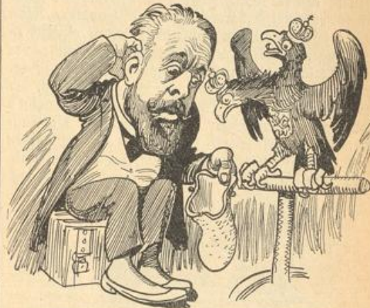
Und der Finanzminister Witte schaut mit bösem Gesicht in seinen Geldbeutel und kratzt sich hinter den Ohren.

der armen Teufel hat der Zar Hebung des Bauernstandes versprochen. Aber was ist zu erreichen, wenn die Beamten, die das ausführen sollen, Spitzbuben sind? Da geht's, wie wenn einst ein großer Herr zu seinen Bauern sagte: Ich will ja nur euer Bestes. Und sie antworteten: das wollen wir aber selber behalten! Daneben ist nun auch noch ein kleines Arbeiterproletariat in Rußland entstanden, das wie die Studenten nur mit Kosacken und Knüppeln und Sibirien in Ruhe gehalten werden kann. Die einzig tüchtigen Menschen in Rußland, die Deutschen, hat man ja geknebelt, neuerdings die Finnen auch. Aber die Mäuler kann man nicht zulleben, soviel Leim hat der Zar nicht, und die Gedanken sind kosackenfrei. So glüht es überall. Und der Finanzminister