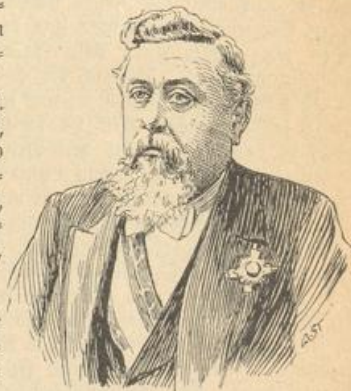
Kallières, Präsident der französischen Republik.

Die Trennung von Kirche und Staat ist nun in Frankreich Gesetz geworden mit 108 Stimmen Mehrheit. Damit werden den zwei Kirchen zusammen jährlich 40 Millionen Staatsbeitrag entzogen, und der gute Bürger muß die Summe statt aus der rechten aus der linken Hosentasche zahlen. Da die Franzosen auch die ernstesten Dinge nicht ohne Narrheiten können abgehen lassen, so haben sie den christlichen Festtagen wieder einmal bürgerliche Namen gegeben. 3. B. Christi Himmelfahrt heißt Blumenfest, Mariä Himmelfahrt Erntefest, Allerheiligen Gedenttag, Weihnachten Familientag. Ferner wollte die Regierung die den Kirchengemeinden gehörigen heiligen Gefäße durch Steuerbeamte „inventarisieren“. Das aber schlug dem Faß den Boden aus. An zahlreichen Orten gab's Brügelen bei und in den