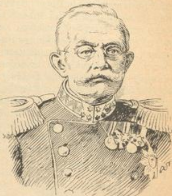
Großherzog Adolf von Luxemburg, † 17. November 1905.

An ihren Früchten sollt ihr sie erkennen! Aber was soll aus einem Volke werden, das eine solche Jugend, d. h. Zukunft hat? Endlich: im Februar stürzte der Minister Fortis — es ist ein schlechter Jahrgang für diese Herren — weil er sich zu sehr den französischenfreund-