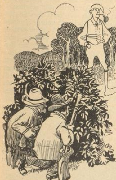
Die zwei Räuber lauerten sie im Hinterhalt.

gestanden. Also Delcassé wurde gestürzt, weil er mit König Eduard über die Köpfe seiner französischen und englischen Ministerkollegen hinaus ein Angriffsbündnis gegen Deutschland abschließen wollte. Wie zwei Räuber lauerten sie im