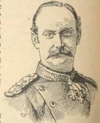
Friedrich VIII., regierender König von Dänemark.

liebenswürdiger Mann, erst 42 Jahre alt, sollte die widerspenstigen polnischen Magnaten mit der Serviette fangen. Aber o weh! Kaum gedacht, war auch dieser Lußt ein End' gemacht. Sein Regiment blieb abermals kürzer als die Leitartikel. Er ging, und ein bisher wenig bekannter Herr Baron Beck wurde erster Minister. Bis der Hinkende unter die Leute kommt, wird vielleicht wieder ein Neuer am Ruder sein. Ein böses Ruder, welches so sehr hinüber und herüber schießt, daß es einen Steuer- mann um den andern aus dem Schiff wirft!