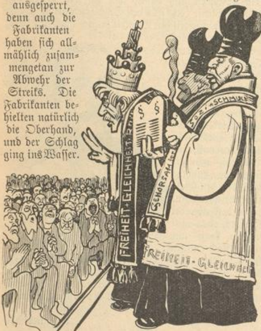
Auf dem Parteitag hatten die Laien nur Ja und Amen zu sagen.

Der Parteitag drohte u. a. auch mit dem Generalstreik. Wie das ausgeht, sehen wir in Rußland, im kleinen zeigte es gleich nach Jena der große Streit bei der Berliner Elektrizitätsgesellschaft; wegen einiger hundert Schraubendreher, die höheren Lohn verlangten, wurden 30 000—40 000 Mann ausständig oder ausgesperrt, denn auch die Fabrikanten haben sich allmählich zusammengetan zur Abwehr der Streiks. Die Fabrikanten behielten natürlich die Oberhand, und der Schlag ging ins Wasser.