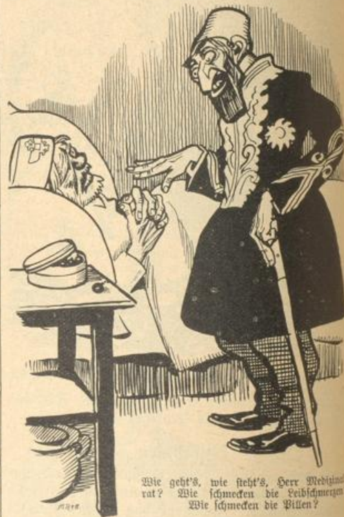
Wie geht's, wie steht's, Herr Medizinalrat? Wie schmecken die Leibschmerzen? Wie schmecken die Pillen?

wird's Licht. Der weise Schah, den die Schulden ebenfalls plagen, will es machen wie die Russen: Er will nicht mehr länger allein an der Pumpe stehen, sondern einer Volksvertretung das Weiterpumpen überlassen. Also versprach er ein Parlament und nannte es „Haus der Gerechtigkeit.“ Das kann