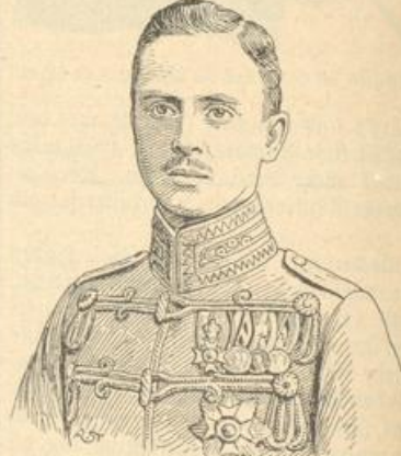
Karl Eduard, Herzog von S. Koburg-Gotha.

ist besser als das eines Soldaten. Das Schwein kennt wenigstens sein Los nicht, es wird schmerzlos, schließlich schnuppernd, durch einen kurzen Beilhieb getötet, während der Soldat... Pfuui Schand! Die blöde Gier nach Fraß und SUFF kann den Menschen wirklich auf die Stufe des Schweins bringen, wie jenes Exempel zeigt.