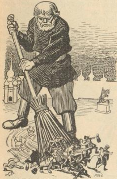
Für diesen Stall braucht das Volk einen eisernen Besen.

vor Schrecken in alle Ecken gucken würde, ob nicht auch hinter seinem Ofen ein Mörder mit der Bombe hervorkriecht. Erst im Januar und Februar brachten Hunger, Angst und Kosaken wieder Ruhe ins Land: die Ruhe des Kirchhofs und der Krute. Ja, die Kosaken haben Rußland, d. h. den Zaren, gerettet. Die Beamtenschaft, die den Kopf ganz verloren und sich feige verkrochen hatte, bekam nach den Niederlagen der Revolution wieder ihren alten Mut — so geht's ja überall bei allen Revolutionen — und zeigte sich nun ebenso tapfer, wie vorher feige. Manchem Beamten mochte auch deshalb das Spießbubenherz ruhiger