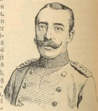
Erbyring Hohenlohe, Chef der Kolonialverwaltung.