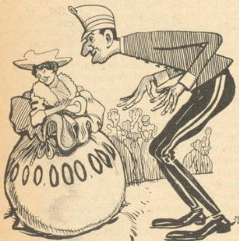
Lange Schwengelte der wackere König Alfons auch um andere Fürstinnen herum.

Bomben nach dem Hochzeitswagen. Die Bombe zerschlug Pferde, Wagen, Menschen, auch Zuschauer, in Stücke. Dem Königspaar geschah gottlob kein Leid. Wie durch ein Wunder entgingen sie dem Verderben. An solchen Greuelthaten kann man ja dem einzelnen Lande, in dem sie geschehen, oder dem der Attentäter entstammt, keine Schuld beimessen. Aber daß in