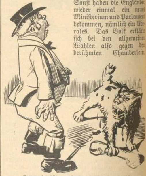
Komm mir nicht zu nahe, den Knochen degnie ich!

Sonst haben die Engländer wieder einmal ein neues Ministerium und Parlament bekommen, nämlich ein liberales. Das Volk erklärte sich bei den allgemeinen Wahlen also gegen den berühmten Chamberlain.