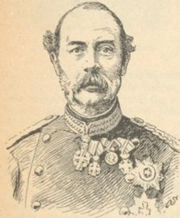
König Christian IX. von Dänemark, † 29. Januar 1906.

scheint sicherer, wie es in Algeciras bewiesen hat. Aber leider ist unser Freund an beiden Beinen etwas gelähmt, am österreichischen wie am ungarischen. Die wackern Magyaren schreien immer ärger, hauptsächlich wegen der 80 deutschen Kommandoworte der Armeesprache. Sie verweigerten Steuern und Rekruten unentwegt weiter, denn die Barone, ihre Advokaten und Prekulis beherrschen das Land. Die Regierung in Wien wollte nun, um deren Einfluß zu schwächen, durch den Minister Fejervary das allgemeine Wahlrecht einführen. Als die Barone dagegen alle möglichen Mittel, auch landesverräterische Broschüren, verwendeten, mußte im Februar das ungarische Par-