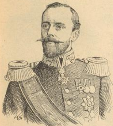
Leopold IV., Fürst zur Lippe.

ist der neue Herzog Karl Eduard mündig und dadurch Selbstregent geworden, ein geborener Engländer zwar, aber seit 15 Jahren in Deutschland. Möge er im Regieren seines Reiches gesegnet sein! Das gleiche gilt von