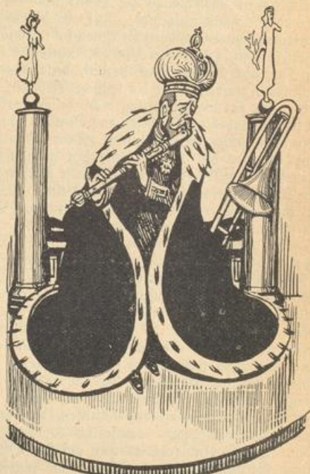
Der arme Zar spielt die Trauerflöte.

Aber wie sah's indessen in Rußland aus! Meuterei der Flotte, des Heeres, Revolution des Volkes, Mord, Brand, Plünderung, Hungersnot, Schulden, Verzweiflung. Dagegen kann keine Konferenz helfen und der Menschenfreund würde am liebsten sein Haupt verhüllen. So sing's an: Der Panzer 1. Klasse Potemkin meuterte vor Odessa. Die Offiziere wurden ermordet oder ausgeschifft. An der Nase des russischen Oberkommandanten vorbei fuhr das Schiff davon. Ein anderes, der Pobjedomoszen, schloß sich ihm eine Zeitlang an. Die übrigen Kriegsschiffe waren ihrer Mannschaft so wenig sicher, daß sie nicht wagten, den Meuterern entgegenzutreten, die sich erst aus Not den Rumänen