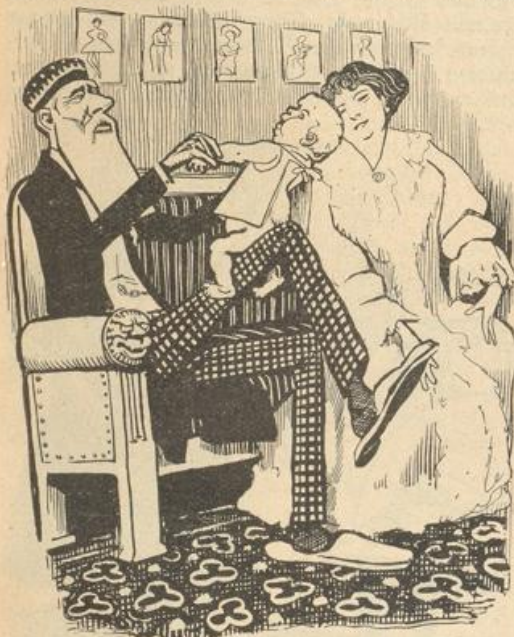
König Leopold, über 70 Jahre alt, wiegt ein Knäblein auf dem Schoß. ist, sagte jener brave Staatsmann und Kardinal. Die ist klug, klüger als Madame Draga.

etwas erzählen? Gut. König Leopold, über 70 Jahre alt, wiegt ein Knäblein auf dem Schoß, das er Gründe zu haben glaubt, für seinen höchstgeigen Sohn von einer Maitresse halten zu dürfen. Deshalb hat er sie in seinem Vaterstolz sogar geheiratet, allerdings nur kirchlich, was ja nicht so verbindlich ist. Eine kluge Frau muß immer Kinder haben, wenn's nötig