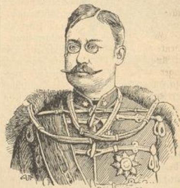
Wilhelm Alexander, regierender Großherzog von Luxemburg.

merken, daß seine Gesundheit erschüttert ist. Sie werden im schönen Italien noch manche Minister erleben, bis endlich einmal mit der scheußlichen parlamentarischen Spitzbüberei ausgeräumt wird. Da ist es wieder herausgekommen, daß durch Betrü-