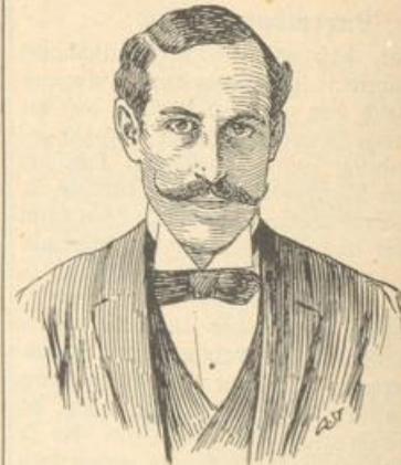
Haakon VII., König von Norwegen.

hat sich wirklich von Schweden losgesagt. Ganz Europa wundert sich nicht wenig, Welch ein neues Reich entstanden ist.