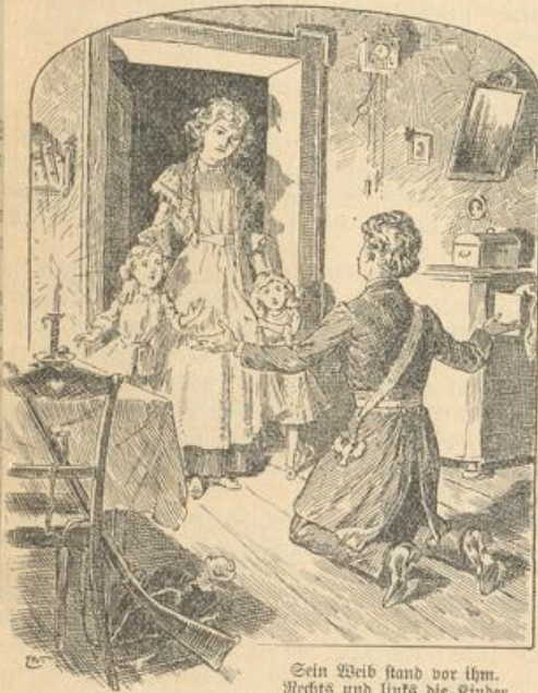
Sein Weib stand vor ihm. Rechts und links die Kinder.

Aber da, auf der Schwelle zum Korridor, stockte