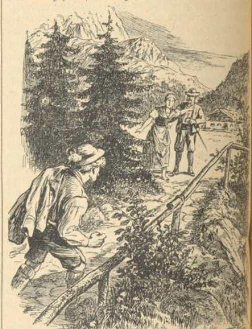
„Jesses, da Loisl, mach, daß d' weita kimmst, Mala!“

Als er ihren Kuß etwas herzhafter erwidern wollte, kam sie ihm selbst entgegen. „So, a Dreingab kriegt a no — jetzt bist aber zufrieden.“