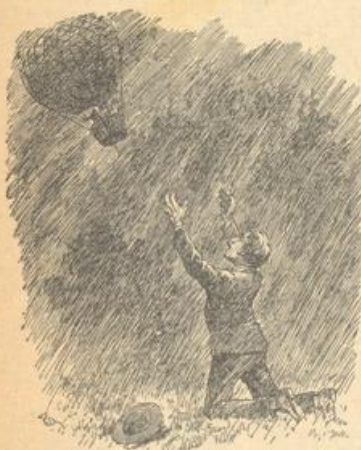
Er fiel auf die Knie und rang die Hände.

Als er, sein Gebet unterbrechend, endlich wieder aufzublicken wagte, war die „höllische Kutsh'n“ mitsamt der Randl verschwunden, und wie spottend und höhneud pffiff und heulte der Sturm um seine Ohren.